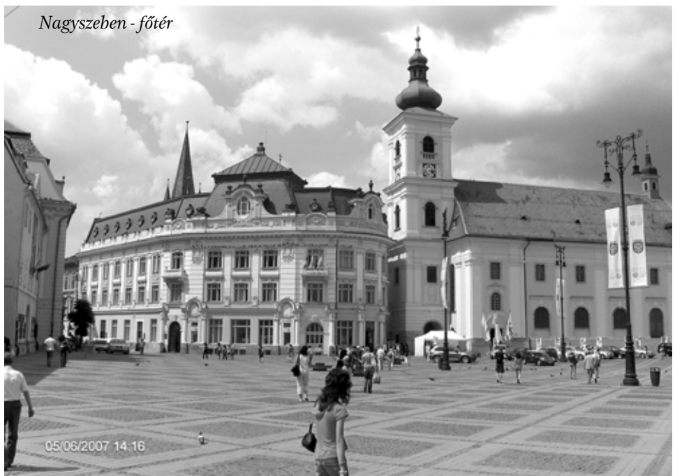
Nagyszeben - főtér

gi körülményei megengedik. Hol van már az az időszak, amikor Magyarországon, esetleg a román okkupáció alatt romladozó Erdély volt uticélunk. A kilencvenes évek első felében még megvolt az érdeklődés bizonyos körökben, de napjainkra ez az érdeklődés alaposan lecsökkent. Pedig kevesen mondhatják el magukról, hogy valóban sikerült megismerniük Erdély nagyszerű természeti adottságait, nemzetiségi sokszínűségét, kulturális és műemléki gazdagságát. Pedig nagy szükség lenne arra, hogy a Kárpát-