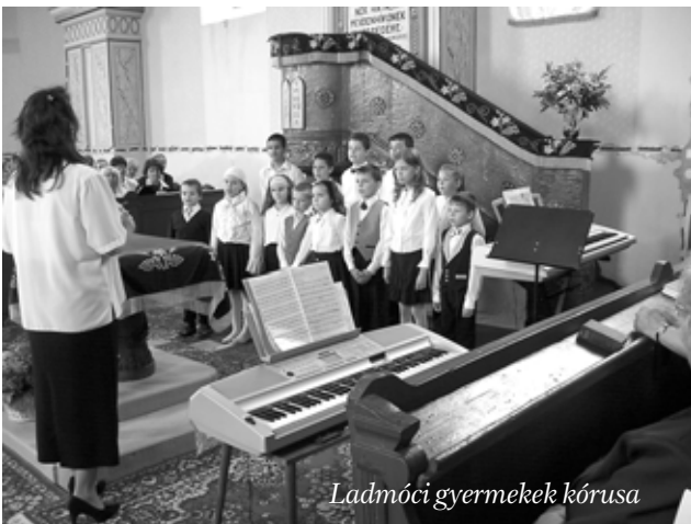
Ladmóci gyermekek kórusa