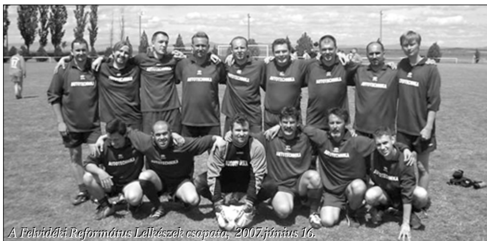
A Felvidéki Református Lelkészek csapata, 2007. június 16.