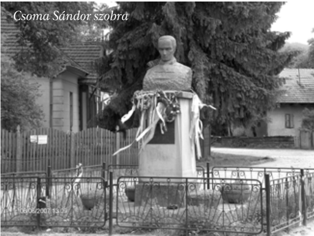
Csoma Sándor szobra

gi körülményei megengedik. Hol van már az az időszak, amikor Magyarországon, esetleg a román okkupáció alatt romladozó Erdély volt uticélunk. A kilencvenes évek első felében még megvolt az érdeklődés bizonyos körökben, de napjainkra ez az érdeklődés alaposan lecsökkent. Pedig kevesen mondhatják el magukról, hogy valóban sikerült megismerniük Erdély nagyszerű természeti adottságait, nemzetiségi sokszínűségét, kulturális és műemléki gazdagságát. Pedig nagy szükség lenne arra, hogy a Kárpát-