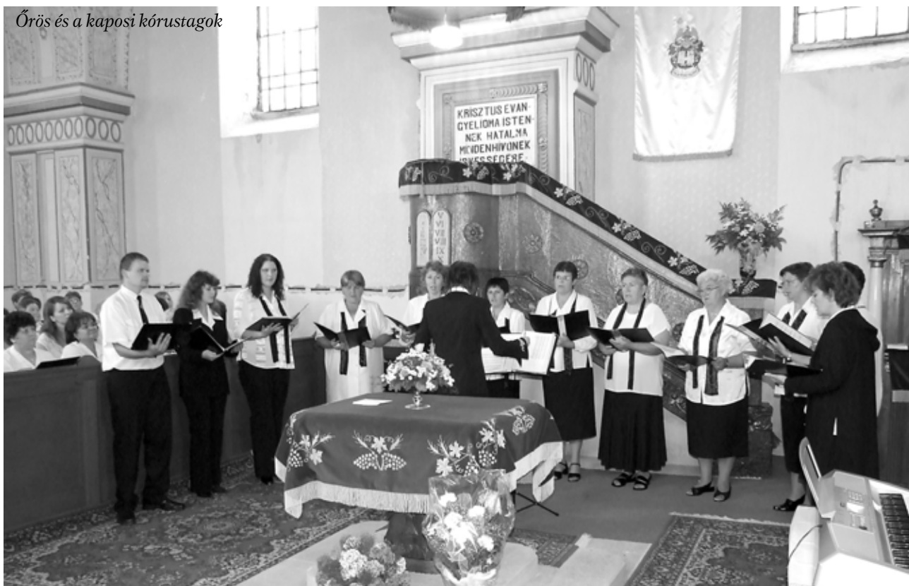
Őrös és a kaposi kórustagok

nőtt-kórus előadása hangzott el, keretbe foglalva az egész kórustalálkozót.