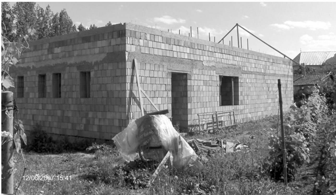
A képen az Abarai református gyülekezet épülő gyülekezeti háza látható