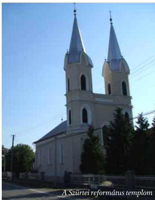
A Szürtei református templom

A nyár folyamán megjelent pápai irat egy időre felkorbácsolta a szenvedélyeket. Protestáns egyházi vezetők, teológiai tanárok sérelmezték azt a megfogalmazást, miszerint a katolikus egyház felfogása alapján a protestáns közösségek nem tekinthetők egyháznak. Még le sem csitultak a kedélyek, amikor újabb, keresztyénnek egyáltalán nem nevezhető magatartásforma, a magyar református képviselők hátrányos megkülönböztetése, mutatott rá a keresztyén közösségen belüli törésvonalakra. Ezen történések figyelmeztetnek bennünket arra, hogy valami nagyon nincs rendben. Kérdezzünk tehát: Létezik-e keresztyén közösség, vagy csak emberi igyekezetet láthatunk egyházi vezetők részéről, annak bemutatására, hogy e közösség felé haladunk? A vatikáni irat, valamint a nagyszebeni „ökumenikus” találkozó érzékeltetik, hogy nincs igazi közösség. De kérdezzünk tovább: Mióta van ez így? Már az első gyülekezetekben komoly apostoli és lelkipozíciós szolgálatra volt szükség a közösség megtartására. Majd következett Markion, aki ugyan összegyűjti Pál leveleit, viszont tagadja, hogy az Ószövetség Istene azonos lenne az