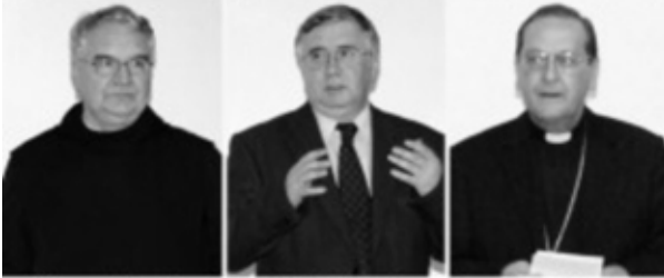
Várszegi Asztrik pannonhalmi fő apát