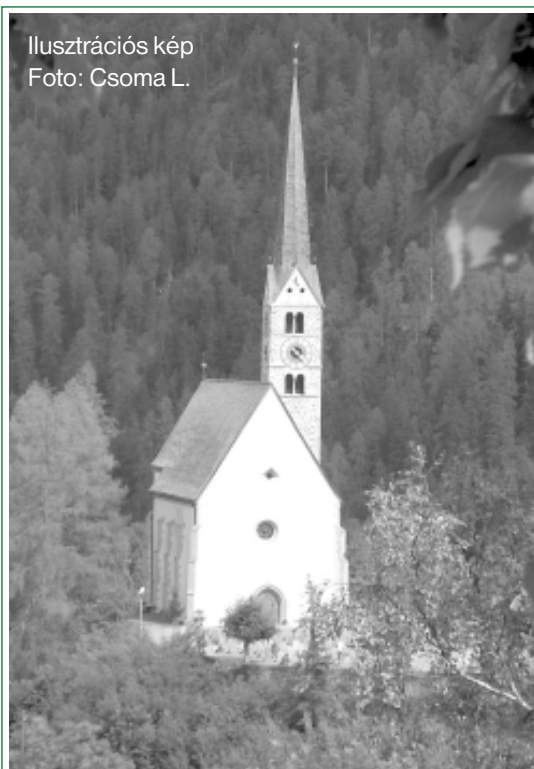
Ilusztrációs kép

szemléljünk, hanem nézzünk alázattal az Ige lelki tükrébe. Timóteus csakis így tud igazán tanítani, és ez által másokat is megmenteni. Ha szüntelenül mások elé tartjuk a „tükröt”, miközben magunk csak bujdosunk mögötte, bizony előbb utóbb meglátszik valós állapotunk. Lehetünk bármilyen elismertek, rangokat, címeket halmozók, valójában csak alakoskodó, másokat tanítani, megmenteni képtelen emberek maradunk.