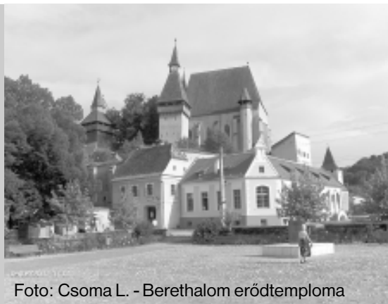
Berethalom erődtemploma

Jelentkezni lehet a 056-6282560 – as telefonszámon, valamint a csoma@copusnet.net e-mail címen