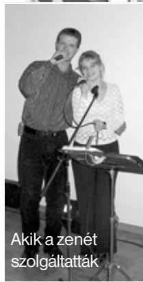
Aki a zenét szolgáltatták

A 2008. február második hetében megrendezett Evangelizációs Hét alkalmain több mint 400-an vettek részt. Erről már hírt adtunk előző számunkban. El kell mondani ismét, az ilyen jellegű közösségre egyértelmű igény van református egyházunkban. Éljük az Úrtól kapott alkalmakkal, nehogy haszontalan szolgáljunk bizonyuljunk!