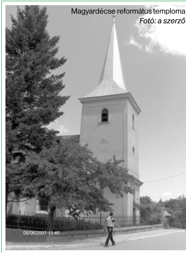
Magyardecse református temploma