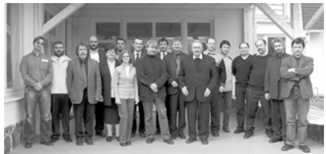
A lelkészeegyesületi konferencia résztvevői

A mintegy harminc résztvevő egyetértett abban, hogy iskoláink lelki, személyi és gazdasági megerősítésére szükség van, de ez azt is jelenti, hogy az alapító fenntartók nagyobb felelőséggel kell felmérniük a diákok létszáma szerinti anyagi lehetőségeket, s elsősorban annak megfelelően kell formálni a pedagógusok létszámát. A kialakult közös vélemény szerint egyházunkban megfelelő számban épültek konferenciái és missziói intézmények, amelyeket jó programokkal kell megtölteni. A további nagy építkezéseket annál is inkább nagyon meg kell fontolni, mivel nem áll rendelkezésünkre megfelelő belső anyagi forrás, s a külső források évek óta szűkülnek. A presztízs-építkezések valójában az egyház gyülekezeteinek alapküldetése (templomok,