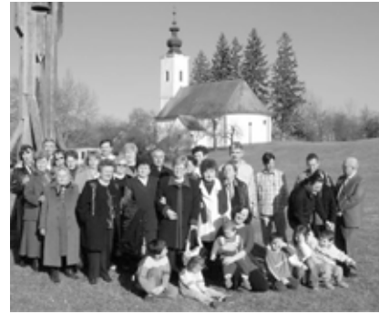
Gyülekezetünk küldöttsége és vendéglátóink a szennai templom előtt

gyománys húsvéti játszóházak várták gyülekezetünk kicsinyeit és nagyjait, ki szép ajándékokat készítettek ezeken az alkalmon családtagjaiknak. Majd Virágvásárnap, március 16-án a szó valódi és legnemesebb értelmében megható események részese volt gyülekezetünk. Lelkészeink meghívására vendégül láthattuk a Dunalmási Református Szeretetház – Fogyatékosokat Ápoló-Gondozó Otthon fiatal fiúkból álló csoportját, akik versmondással, énekekkel szolgálva tettek bizonyosságot templomunkban, mindannyiunk szemébe könnyeket csalva és nagy sikert aratva. Az istentisztelet perselypénzével az Otthon munkáját támogattuk, és gyülekezeti lapunk ez alkalomra készült számával is megajándékozhattuk vendégeinket. Végül szeretetvendégség közben (melyért legyen köszönet minden kedves testvérünknek) alkalmunk nyílt a beszélgetésre, ismerkedésre, majd a városban tett séta után ebéd várta vendégeinket. Áldott, szép nap volt... Nagyheti, húsvéti alkalmaink is szép rendben zajlottak, magas gyülekezeti részvétel mellett. Istentiszteleteink, gyülekezeti lapunk cikkei és tanításai megszentelték nagyhetünket és örömtelivé varázsolták a télies időjárásban érkező húsvétot. Istennek legyen hála azért, hogy így szeret bennünket.