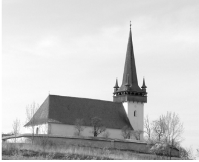
Magyarkapus református temploma - Erdély

nekünk adatott Szentlélek által.” (Róm 5,3-5). Ez az első fontos üzenete az igének.