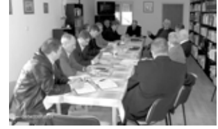
Ref. Lelkészeegyesületeinek Választmánya