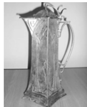
A beregsomi gyülekezet úrasztali kannája