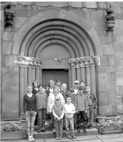
A románkori templombejárat