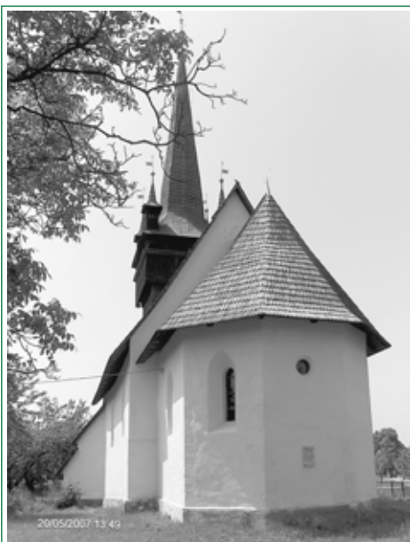
Csetfalva református temploma Kárpátalján

tan kárvallott ember, csalódott szülő, hitves aggódva kérni hová fejlődik világunk? Mi állíthatja meg közösségeink erkölcsi széthullását, gyülekezeteink leépülését? A legtöbben valami nagy csodát várnak. Csodát, amelyik megrázza a világot, s ráébreszti az embert a megújulás szükségességére. Pedig hiába várunk a csodára! A csoda már megtörtént! Isten ígét adta, s Jézusban megpecsételte annak igazságát. A Zsoltárok könyve 39. része a hitelesség alapszabályát tárja elélnk. „Ezt határoztam: vigyázok szavaimra, hogy ne vétkezzem nyelvemmel, megzabolázom számat, ha gonosz ember kerül elélem.” Az evangéliumban Jézus emlékezteti hallgatóit, köztük a farizeusokat, hogy az tesz tisztátalanná ami elhagyja ajkunkat, mert az a szívből jön: indulat, gyűlölet, harag, ítélezés...stb. A hallgatás, azonban nem oldja meg a dolgokat. A saját elhatározásából némán maradó emberben csak gyűlnek a feszültségek. Ezt a zsoltáríró is megtapasztalta. Igazán akkor van értelme a hallgatásnak, ha annak hit alapja van, vagyis azért hallgatok, mert tudom, hogy Isten cselekvő kegyelme ölel körül. „Néma maradok, nem nyitom ki számat, hiszen te munkálkods.” Zsolt. 39,10 Ez a hallgatás nem okoz feszültséget, mivel a munkálkodó Istenbe vetett hitből fakad. Ez a hallgatás nem enged perlekedni még akkor sem, ha igazunk van, mivel Isten megigazító kegyelmében gyökerezik. Ez a hallgatás nem a tehetetlen düh összeszorított ajkú hallgatása, hanem