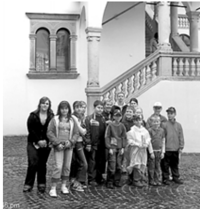
A pataki vár udvarán