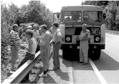
Néha a busz is megpihen

A deregnyői Református Keresztény Gyülekezet presbitériumának régi terve valósult meg 2008. augusztus 15-17-én, amikor a nagyszelmenci határátkelőnél átlépve a szlovák-ukrán határt magyar református testvérekhez látogattunk. Maga a helyzet fonáksága, hogy szlovák-ukrán határt lépünk át, miközben mindkét oldalon magyar közösségek élnek. De a panasz helyett hálat adhatunk a Mindenhatónak, hogy amikor annyi éven át csak megállhat-