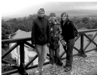
Együtt esőben, szélben

közben, vagy belemászni saját étkezésletével a közös tálba vagy elkapkodni más elől az ételt, akkor szigorúak vagyunk, de azt hiszem, ettől nem meg-