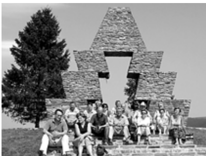
Verecke híres emlékműve

tunk a keskeny mellékúton, s épp hogy átnézhattunk az erősen őrzött határ másik oldalára, mostanra már át is mehetünk, ha az ukrán határőrök nem lassítják az átkelést. Márpedig lassítják, mégpedig annak reményében, hogy a túloldal üzlettulajdonosaitól nagyobb összegű „támogatást” sikerül kieszközölniük fizetésük feljavítására. Isten azonban itt sem hagy magunkra minket, mivel a túloldalon várakozó lelkész és presbiter testvér, aki egyben járási képviselő közbelép. A sorból kiemelnek, kitöltjük a csak ukrán és angol nyelvű űrlapot, megkapjuk a pecsétet és már „külföldön” is vagyunk, de mégis otthon. Szürte érintésével már indulunk is Ungvár várának megtekintésére. A szakszerű magyar vezetés mellett van módunk feleleveníteni a ciril-betűk ismeretében szerzett jártasságunkat is. Sajnos az utóbbi hetek esői következtében nem tudunk a vendéglátó gyülekezetben, Szürtén megszállni, de a nagydobronyi gyermekotthonban minden