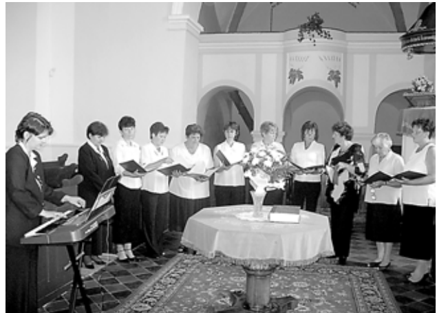
A Zádorháza-Rimaszécs gyülekezetének női énekkara

19-én, szombaton a nagyvárad-i vendégeink egy előre betervezett kiránduláson vettek részt. Szerettük volna megmutatni nekik egy kis szeletét a Felvidék, azon belül is a gömöri táj szépségeinek, nevezetességeinek. A kirándulás állomásai a következők voltak: Nemesradnóton megtekintették Pósa Lajos és Radnóti Miklós szobrát, majd Zsípén egy 750 éves templomot, ami arról nevezetes, hogy a falain még láthatóak az eredeti festés részletei, ami a tíz szűz példázatának képeit ábrázolja. A következő megálló a krasznahorkai vár volt, azt követően pedig Betlérben, az Andrássy család kastélyában tettek látogatást. Az út végét Rimaszombat, a gömöri térkép egyik központi városa jelentette, ahol Petőfi Sándor és Tompa Mihály szobrát nézték meg, az utolsó állomás Hanva volt, ahol Tompa Mihály síremléke található.