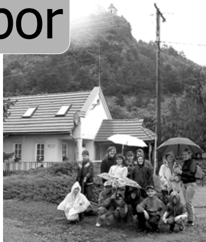
A várba nem mentünk

Amikor elkezdődött a tábor, megkérdeztük a gyerekeket, ki honnan hallott a táborról, hogyan jutott el hozzánk. Ki-ki megválaszolta: újságból, barátoktól, anyuka küldte... Azonban hallottunk egy érdekes dolgot: az egyik kislány azt mondta, hogy kicsit félve jött, mert azt mondták, hogy ez a tábor nagyon szigorú. Meglepődtünk. Most kezdhetném azzal, hogy nem, ez nem igaz, de nem ezt fogom tenni. Miért? Mert ha szigor van, az azért van, mert nem hagyjuk az „ösztönöket” eluralkodni. A program az órákon kötött, ezen felül van szabadidő, van lehetőség tanulni, játszani és viselkedni. És azt hiszem ez az utolsó szó a gond forrása. Ha ezt jelenti a szigor, hogy nem hagyunk valakit az asztalon ugrálni és