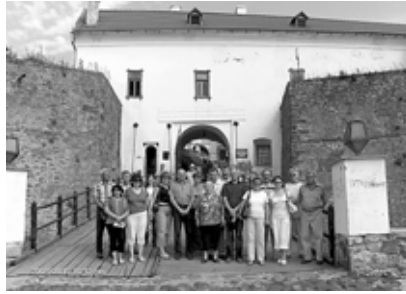
Munkács várának kapuja nyitva volt előttünk