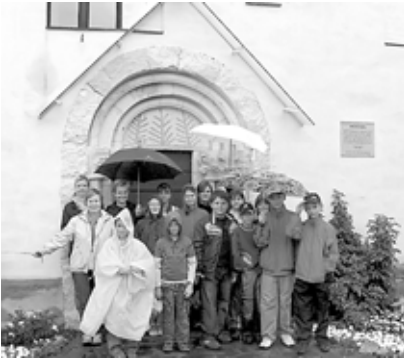
Fűzér esőben, szélben