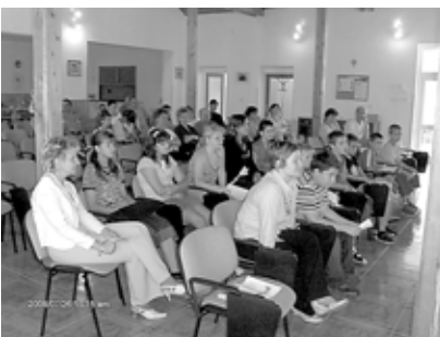
Szombat a szülőkkel

találtunk megoldást. Úti célunk a Fűzéri vár volt, de a szakadó eső és erős szél nem engedett fel bennünket, azonban később enyhült az idő és így megtekintettük a sárospataki várat és múzeumát, majd Karcsán a református templomot. Itt a templomban a gondnok néni elmesélte a templom történetét, amit ha a Kedves Olvasó tehet, hallgasson meg egyszer, tényleg érdemes. A gyerekek meglepő módon, a rossz idő ellenére is egyetlen szó nélkül vidáman, szórakozva, tele energiával és jókedvvel töltötték a napot. Természetesen a fáradt gőzt ki kell engedni valahol, ezért a rosszcsonstjelzőt is kiérdemelték, azonban örömmel tapasztaltam, hogy a gyerekek ismerik a játék értelmes és intelligens módját is. Minden este megegyeztek mit, és hogyan fognak játszani, mesét néznek, egy kicsit számítógépeznek, activityznek vagy talán „Maffiáznak”.