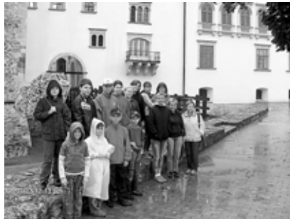
Sáropatak enyhébb volt