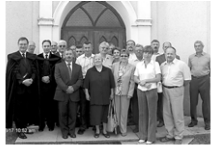
A templom előtt