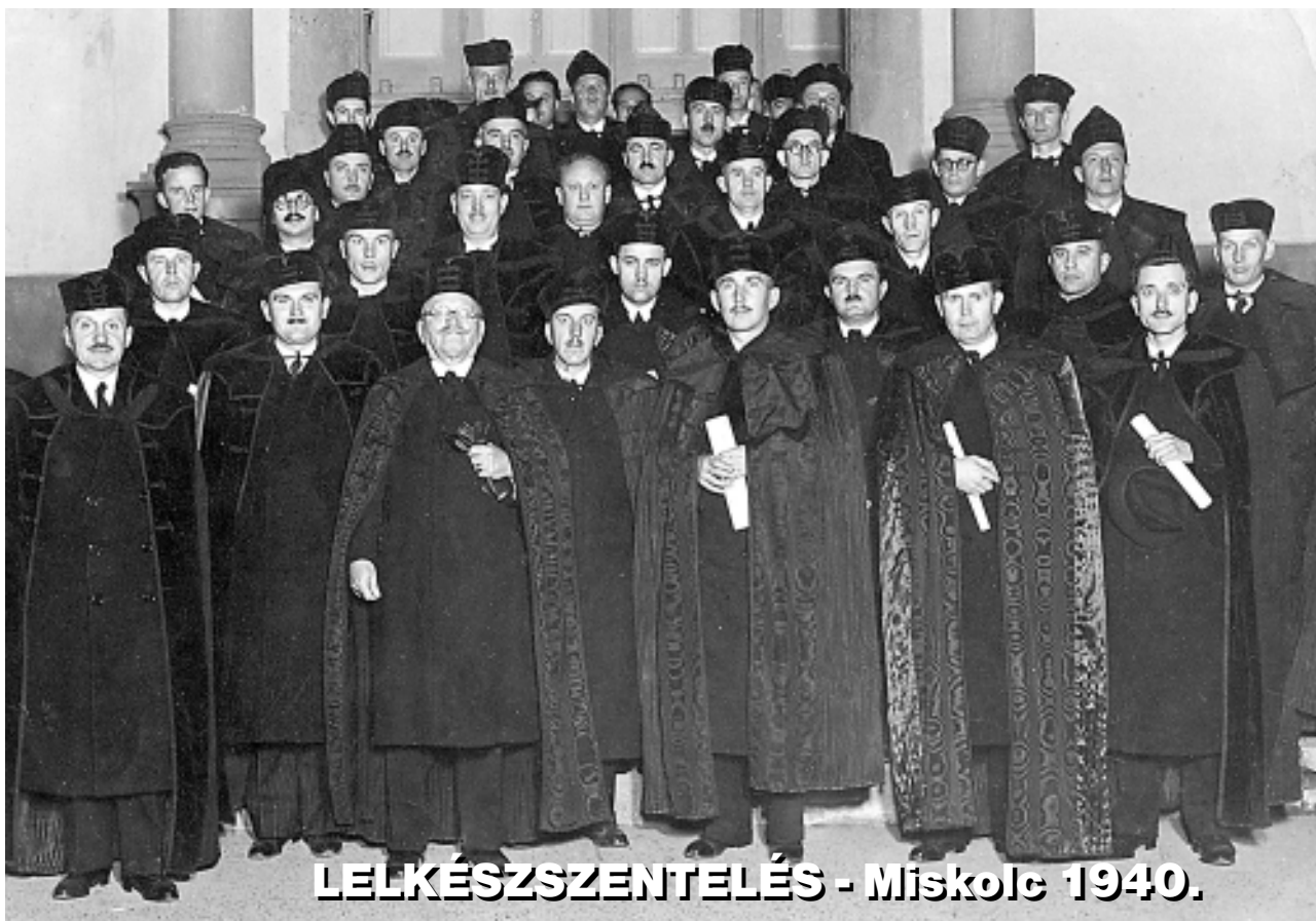
LELKÉSZSZENTELEÉS - Miskolc 1940.