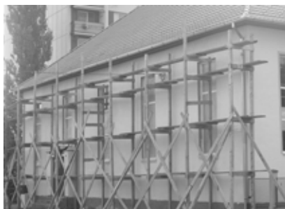
A Garam utca felőli oldal