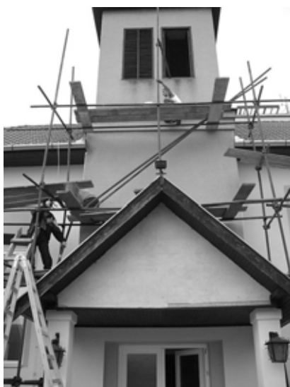
A torony felállványozása