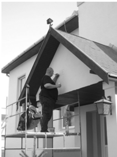
Dolgozik a címfestő