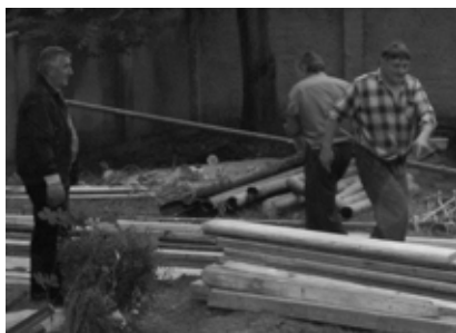
Gyülekezeti tagok állványozás közben