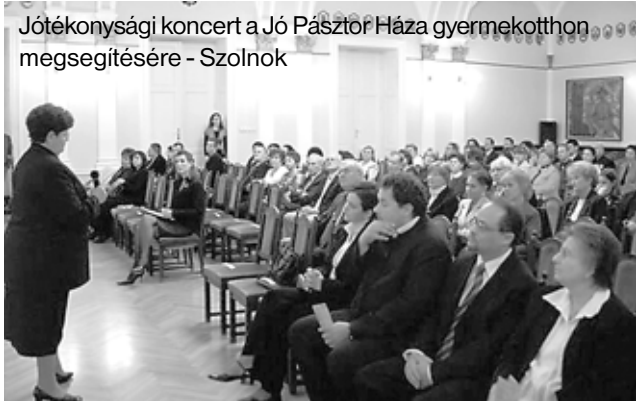
Jótékonyági koncert a Jó Pásztor Háza gyermekotthon megsegítésére - Szolnok

A karácsony ünnepét megelőző szentestén 35 gyermek adott elő kedves műsort, versekkel, énekekkel s az énekkar szolgálatával. Ezen az alkalmon kerültek szétosztásra a Samaritan's Purse-program által közvetített karácsonyi csomagok, amelyek minden gyermeknek nagy örömet szereztek.