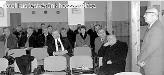
Katolikus testvérünk hozzászólása

Teológia könyvtárának igazgatója szolgált történelmi „Kálvin – képpel”. A mintegy harminc résztvevő lelkész, presbiter és gyülekezeti tag az előadás mellett a különböző Kálvin ábrázolások vetített képeit is megnézhetette. Nagyon jó hangulatú beszélgetés alakult ki a résztvevők között, melybe egy Magyarországról érkezett katolikus testvérünk is bekapcsolódott. A további konferenciák alkalmával szakavatott előadók adnak áttekintést Kálvin sokrétű munkájáról, hit és társadalom formáló tevékenységéről.