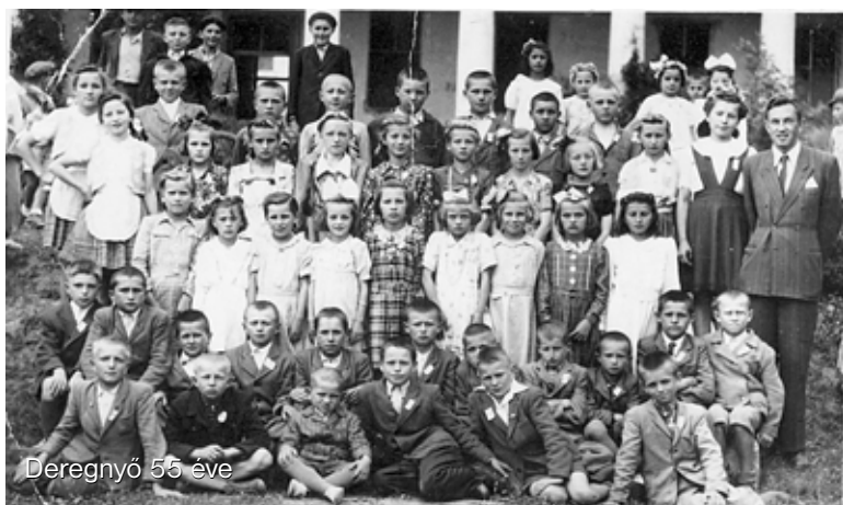
Deregnő 55 éve