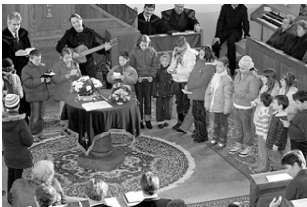
A gyermekek bizonyágtétele a lelkészházaspár vezetésével

Erre a meghatározó eseményre emlékeztünk 2008. december 6-án a zselízi templomban, ünnepelő gyülekezet közösségében. S ezen az ünnepen adhattunk hálát azért is, hogy az elmúlt 7-8 esztendőben rengeteg adakozás, imád-