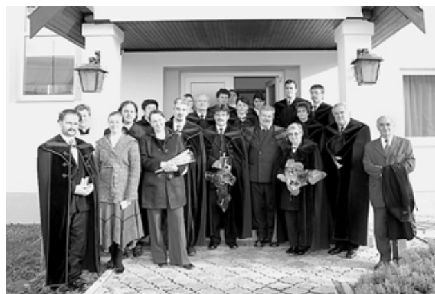
Az ünnepen résztvevő lelkészek egy csoportja