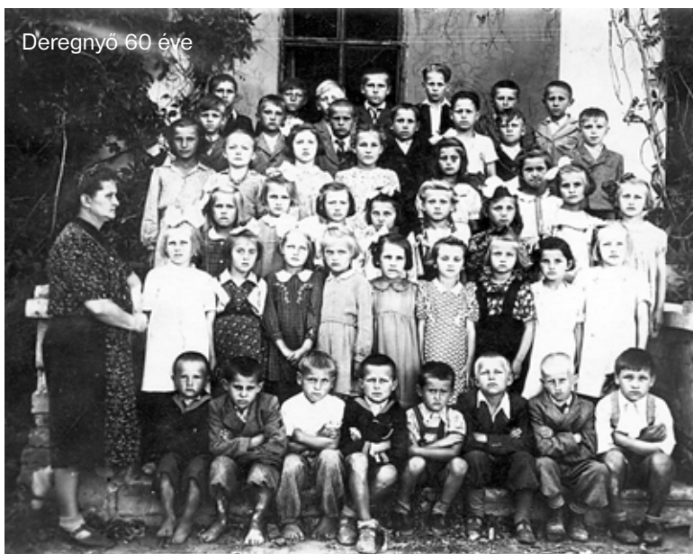
Deregnő 60 éve