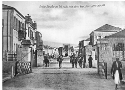
Tel Aviv - Fő utca