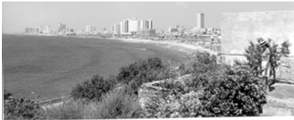
Tel Aviv korábban

A mai Tel Aviv környéke már Kr. e. 6000-ben is lakott terület volt, de találtak itt héber nyelvű szövegtöredékeket a Kr.e. 9. századból is. Pesach, azaz a zsidó Húsvét vasárnapján 1909. április 11-én, a templom Kr.u. 70-ben történt lerombolását követően a 70. nemzedék (egy bibliai nemzedék 27 évet jelent) kezdte el a haza-telepedést ezen a napon. A beépíthető telkeket kisorsolták az érdeklődők között, 60 fehér kagylóra a neveket, 60