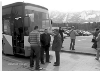
Mögöttünk már havas hegyek