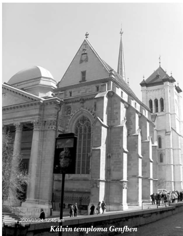
Kálvin temploma Genfben

Keveset szoktunk arról beszélni, hogy a Jézus korának zsidó társadalmi törekvései sorra megbuktak. Három évtizeddel a Golgota után pedig teljesen összeomlott az az ország, a miért oly sokan küzdöttek. Szabadságot, függetlenséget, önrendelkezést, jólétet szerettek volna, és mindez az igaz törekvés sikertelen volt. A római seregek lerombolták a jeruzsálemi templomot. Ma is a megmaradt falrészhez járnak imádkozni a zsidók. Megszűnt az áldozás a zsidó hit központjában. Megtorlások során emberek ezreit végezték