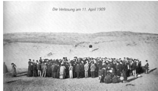
Homokdűnék között 1909.04.11-én