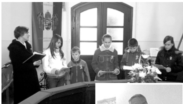
A fiatalok műsora

Március 15-i megemlékezésünk a Szózat eléneklésével ért véget.