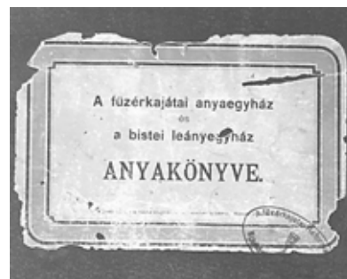
Az egykor közös anyakönyv