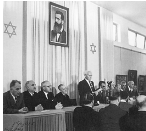
Ben Gurion kihirdeti Izrael állam létrejöttét