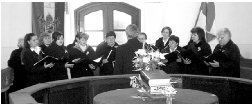
A Női Kórus éneklés közben