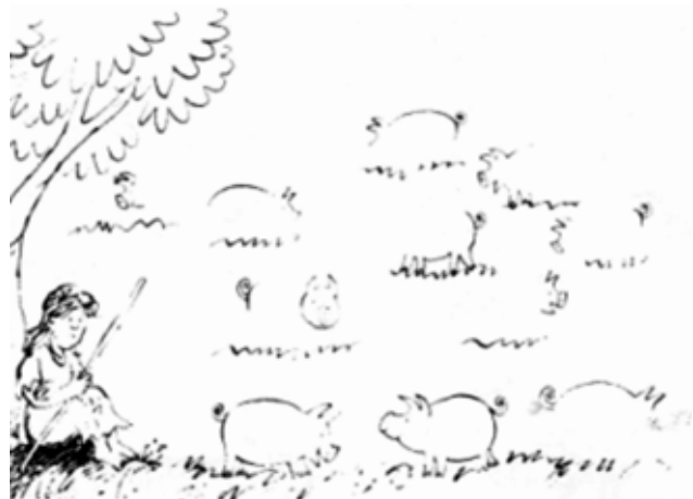
A tékozló fiú disznókat őriz. Egészsítsd ki a képet

Ez a történet megtanít bennünket arra, hogy nem csak akkor kell értékelnünk az életünk értékes dolgait, amikor már elveszítettük ezeket, hanem akkor is, amikor még megvannak. Használjuk tehát az életünket arra, amire az Isten adta, hogy megismerjük őt, hogy közel kerüljünk hozzá.