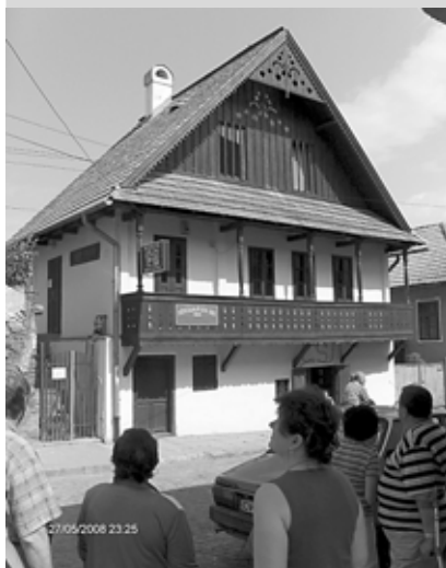
Műemlék ház Kézdivásárhelyen

Jelentkezni és befizetni 2009. július 10-ig lehet szerkesztőségünk címén vagy a gyülekezet számlaszámán. Bővebb tájékoztatással a 056 6282560, 0908 035 094-es telefonszámokon szolgálunk.