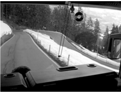
A szerpentinén is elfért az autóbusz

Vasárnap. Keresztyén csoport lévén első utunk istentiszteletre vezetett. Kirchlindach -ban, Berntől 7 km-re fekvő kis városkában megtapasztalhattuk, hogy gyökeresen más fogalmaik