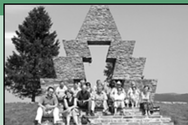
Verecke híres emlékműve