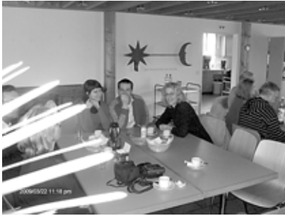
Kirchlindach gyülekezeti termében

Hétfő. Ha Kálvin, akkor Genf . Milyen ez a tó parti (Genfi tó) város? Hangulatában, mentalitásában eltér a német nyelvterület városaitól. Itt már kőkemény franciák élnek (volt aki fel is róttá, hogy közülünk valaki németül