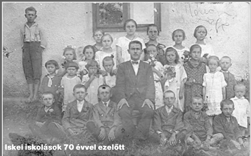
Iskei iskolások 70 évvel ezelőtt