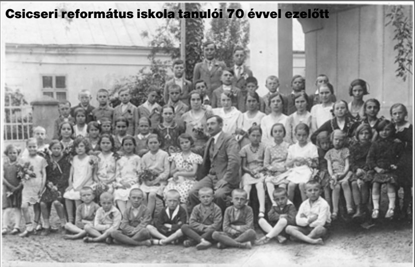
Csicseri református iskola tanulói 70 évvel ezelőtt