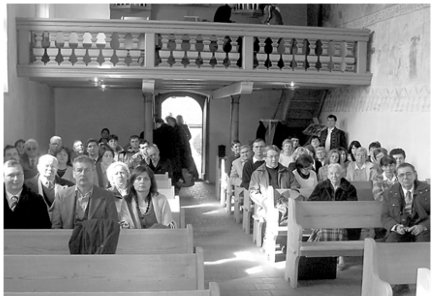
Kirchlindach - vasárnapi istentisztelet

tunk olyan hosszú utat megtenni a „Kálvin-év” alkalmából. Még egy érdekesség. Az istentisztelet végeztével nem igazán rohantak haza, hogy vasárnap van, és ebédet kell adni a családnak. Szépen átvonultunk a gyülekezeti házba teára, kávéra, egy jó beszélgetésre. A teljességhez hozzá tartozik az is, hogy ez nem mindig, csak havonta egy vasárnap van így. Murten-koraközépkori városnak magával ragadó hangulatát meg sem próbálom leírni. Csak egy érdekességet a városkáról: Farel Vilmos (kinek szobra Genfben a „Reformátorok Falán” is megtalálható) sok svájci városban megfordult, és hirdette a reformátori tanokat. Murten utcáin, mezőin is prédikált. A templomon emléktábla is felhívja erre a figyelmet. Gruyères-a hegyre épült