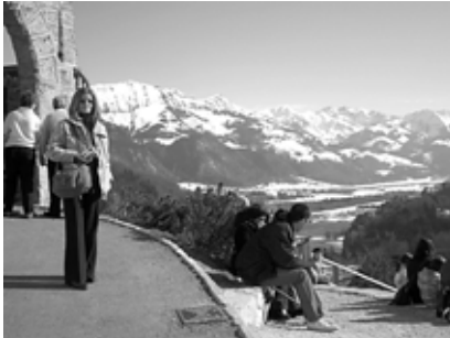
Gruyères várának kapujában

istentisztelet fő mondanivalója a környezetvédelem), énekeskönyvükben majd 800 német, angol, latin (és még lehet, hogy más nyelven is, de hirtelen ezeken akadt meg a szemem) nyelvű dicséret, természetesen zsoltárok az elején, de azt a zsoltárt, amit nem zenésítettek meg, egyszerűen felolvasták