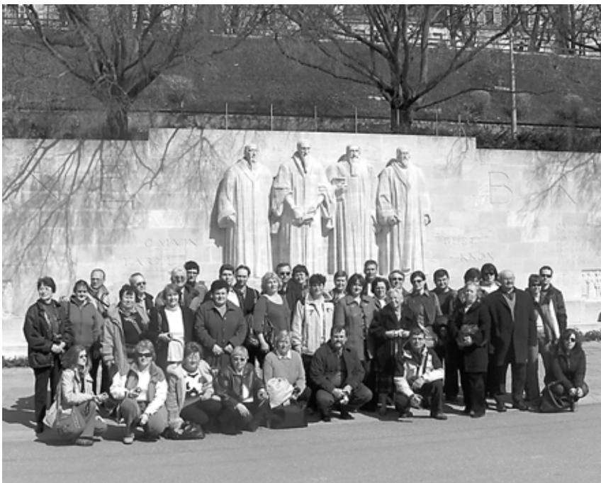
Genf - a reformáció emlékműve előtt