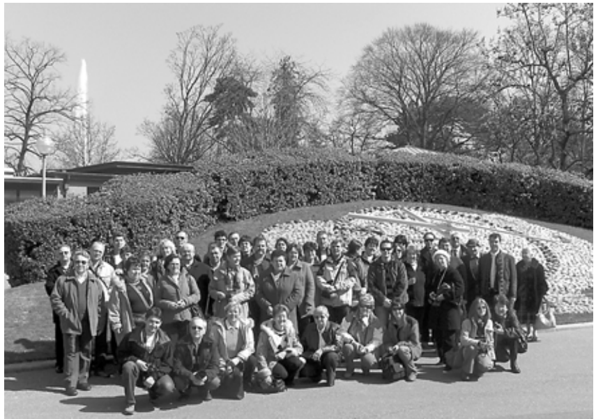
A virágóra előtt Genfben

megtenni. Mivel mi tanulmányi kiránduláson vettünk részt (és nem emberkínzáson), az első éjszakánkat Ausztriában, Ernthofenben, egy kellemes családi vállalkozásként működtetett Hotelben töltöttük. A családfő egyben volt a Hotel menedzsere, felszolgáló, ha kellett karbantartó, földjét művelő