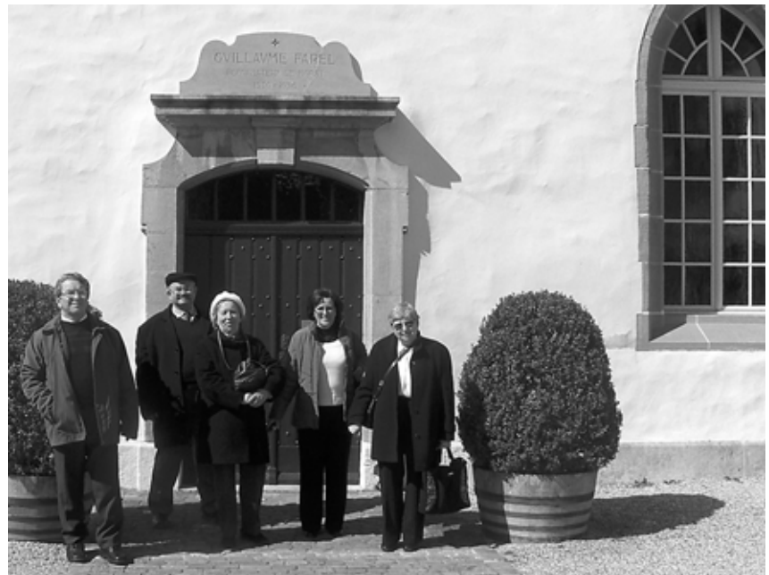
Murten-Farel temploma előtt

születésének 400. évfordulóján avatták fel. Bocskay István domborműve is megtalálható. A "győztes erdélyi fejedelem" felirat az 1606-os bécsi békére utal (az erdélyi fejedelem a királyi Magyarországon is be akarta vezetni az Erdélyben már fél évszázaddal korábban törvénybe iktatott vallásszabadságot). Lausanne jó „kis” meredek, hegyoldalra épült város. Itt jó kis „városnézés” volt. Alig találtunk busz parkolóhelyet, pedig személyautóknak volt akármennyi. De azért sikerült! Meg is néztük a katedrális és Pierre Viret