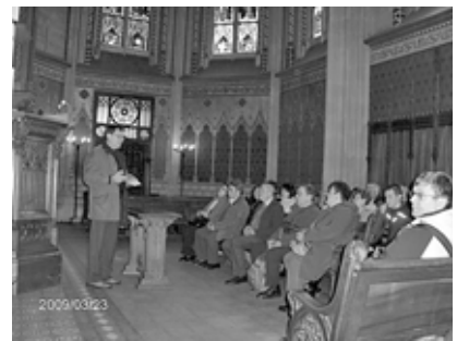
Genf - Kálvin templomának oldalkápolnájában

vannak az istentisztelet menetéről, milyenségéről. Persze volt ének, igehirdetés, gyerekek is szerepeltek, sőt még egy énekkar is, de a Lelkésznőn nem volt palást, de még fekete- fehérben sem volt (nem igazán adnak a formáságokra!), az ifjúság egy része szépen felment a szószékre, onnan mondta el mondókáját (az egész