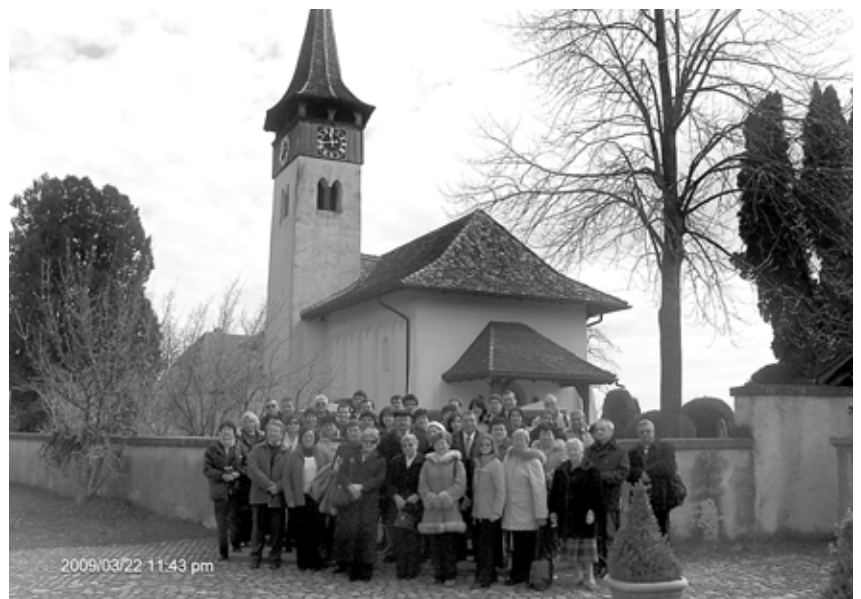
Vasárnapi Istentisztelet után - Kirchlindach