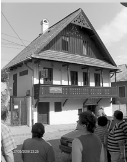
Műemlék ház Kézdivásárhelyen