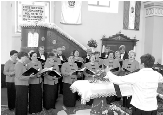
A NAGYKAPOSI ERDÉLYI JÁNOS VEGYESKAR