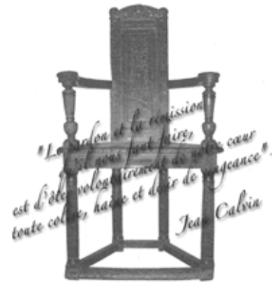
A Kálvin év alkalmából kiadott emlékborték

oda. Ezután Budapest. Dudálás, mutogatás... Hogy mit lehet erre mondani? Hazajöttünk. Elég kijózanítóan tudunkra is adták. Nos, mi ide „fejlődünk”. Mi lett volna ha nem lett volna Kálvin? Végakarata szerint jeltelen sirba temették le. Félt attól, hogy kultusz fejlődik ki körülötte. Hatását, ami nem csak az erkölcsi, de a gazdasági életre is kihatott, nem lehet, nem szabad letagadni. Nagy pestisjárványok pusztítottak az ő korában, ami után óriási drágaság és nélkülözés következett. Genfben, Kálvin váro-