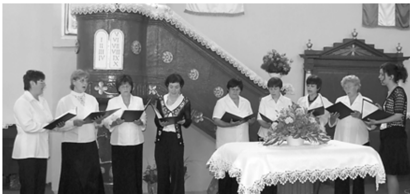
A KISGÉRESI ÉNEKKAR