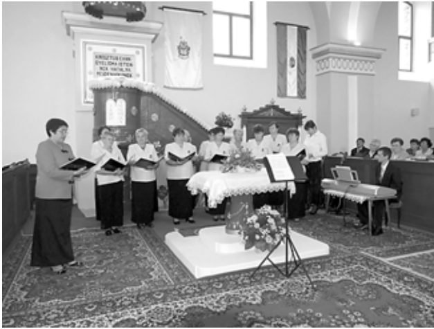
A MOKCSAKERÉSZI IMOLA DALKÖR