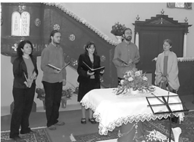
LUX AETERNA KAMARAKÓRUS

Jó volt együtt hallgatni a kórusokat, akiknek repertoárjában ez évben, a szervezők kérésére, egy-egy zsoltár is elhangzott (feldolgozásban, idegen nyelven, vagy „csak” a maga nemes egyszerűségében, ahogyan az énekeskönyvben található), a Kálvin-év jegyében.