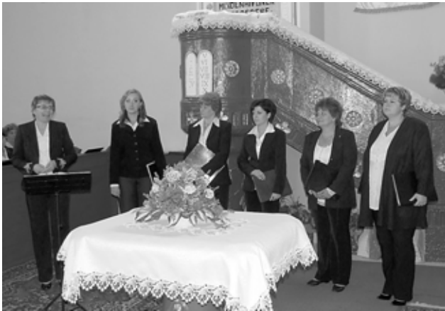
A NAGYKAPOSI CANTABILE KAMARAKÖRUS