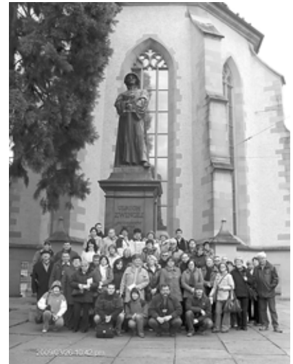
A Zwingli szobor előtt

profétákat ábrázolja, a piros és tengerészkek ablak pedig a törvényt látható). A Limmet folyó hídján átsétálva legelőször a nagy reformátor Zwingli Ulrich szobrát kerestük fel. Ha valaki fel szeretné keresni, ott van a Wasserkirche (Víz templom) mögött. Mint később megtudtuk, a római korban a város két védőszentje Felix és Regula vártanuk ezen a helyen haltak mártírhalált. A legenda szerint miután a templom helyén lefejezték őket, felkapták a levágott fejüket, és felcipelték a dombtetőre, ahol most a Großmünster áll. A főszékesegyház oldalán, vagy mondjam inkább, hogy a falából kiálló köven Bullinger szobra áll. Itt találkoztunk idegenvezetőnkkel, aki büszkén