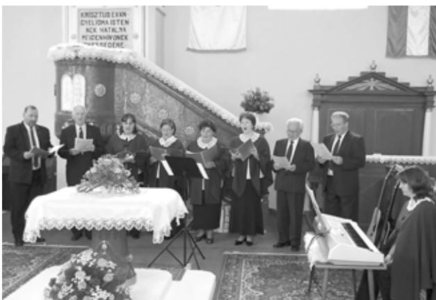
A SÁROSPATAKI KÓRUS TAGJAI