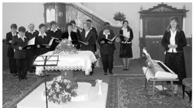
A KISKÖVESDI NŐIKAR