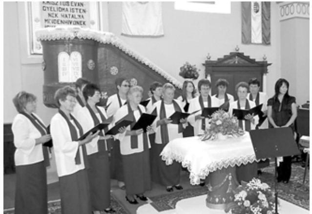
AZ ÁGCSESNYŐI CSERFAÁG NŐI KAR