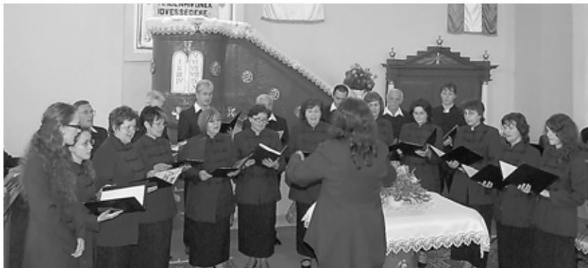
A KASSAI MAGYAR REFORMÁTUS GYÜLEKEZET KÓRUSA

Immár hagyományosan, Pünkösdt követő hétvégén, ismét megrendezésre került a ladmóci kórustalálkozó. Nem véletlenül nem írtam le, hogy Szentháromság-vasárnapon, hiszen a jelentkezők száma miatt június 6-án és 7-én is felcsendült az éneklők hangja a helyi református templomban. A templomról jó elmondani azt is, hogy belülről szinte teljesen felújításra került, már csak a kisebb munkálatok váratnak magukra, amint azt az anyagi keretek lehetővé teszik.