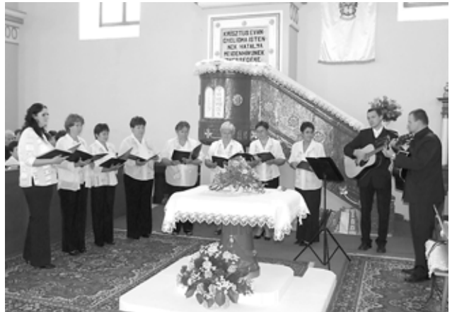
AZ ÖRÖSI ÉNEKKAR