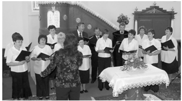
A LADMÓCI KÓRUS