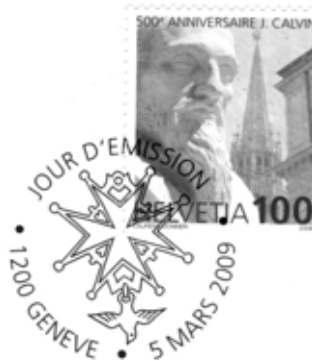
A Kálvin év alkalmából kiadott emlékbélyeg

sában a munka kötelező volt. Aki nem talált, ő segített, mostani szóval élve a munkahelyteremtésben is. Bizony az ő javaslatára lendült fel újból a posztókereskedelem, bársonyszövő ipar, aranyművesség. A svájci óra pontossága világszerte ismert. Nem véletlenül választottam az erről szóló közmondást beszámolóim címéül, mert még az óragyártás megerősödésében is nagy szerepe volt a reformátornak, és mi mindenre volt hatással a felsoroltakon kívül! Bizony hiányosak az ismereteink. A morc külső, kemény tekintet, testileg beteg, de hitben