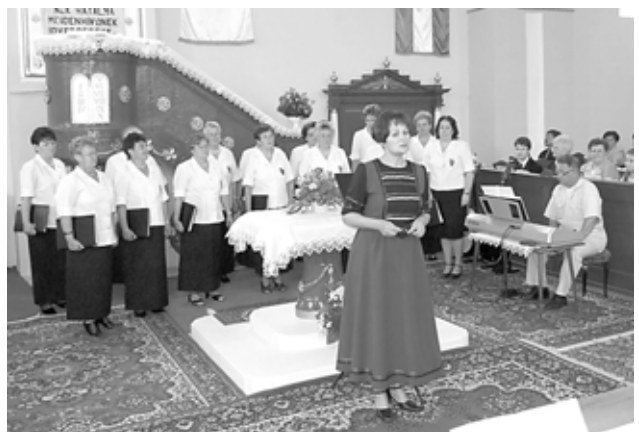
KIS- ÉS NAGYTÁRKÁNYI CALIX NŐI KAR