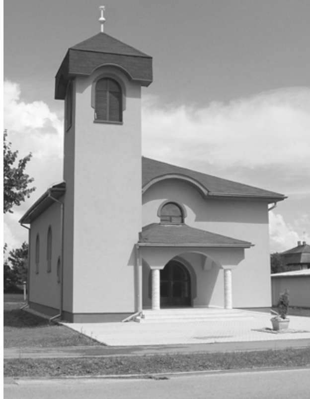
Újhely református temploma

mennyei Atyánktól. És arról sem feledkezünk meg soha, hogy annak, aki adta, számot kell adnunk róla! Ezért nem ejt kétségbe a világ látványos üressége, nem rettent meg a világ szerint élő ember alattomos gonoszsága, nem ejt rabul haszonlesők hízeltedése és a felfuvalkodott magamutogatása sem. Sőt arra ösztönöz minden Krisztust követőt, hogy még nagyobb buzgósággal igyekezzen az örökkévaló, Istentől kapott értékek megélésre, hogy Krisztusban megigazulva az örökkévalóság gyermekei legyünk.