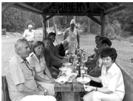
Ebéd a szabadban