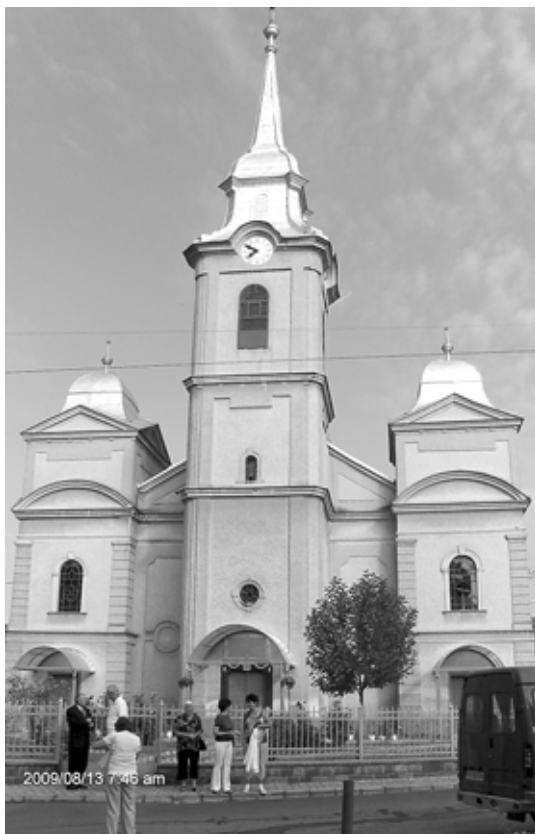
Nagydobronyi református templom

komoly biztatás volt egykor Izrael népe számára. Az ígért földje határánál Isten nem a körülményekről beszél Izrael népével. Ugyanis a körülmények a megígért földet tekintve a pusztai vándorlás eltelt negyven éve alatt