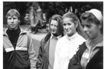
1989 - arcok a táborból

Csak hogy a csillebérci táborban másról is szóltak a vallomások. A berlini kutatóorvos így fogalmazott: „Nem akarok egy életen át lakással, pozícióval megvásárolt lekötelezettje maradni annak az államnak!”. Egy drezdai mérnök pedig így: „ Elegem van abból, hogy gyereknek nézzenek, és mások mondják meg, mit szabad, mit nem, miről mit gondoljak. Elég volt a gyámkodásból! ”. „Nekünk mindenünk megvolt otthon. Saját üzletünk volt, gazdagok voltunk. De bezárva.