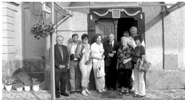
Nagydobronyban reggeli istentisztelet után