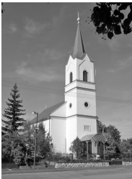
Alsómihályi református temploma

A lélek belső békességét az Istennel való kapcsolatunk megszakításával veszítettük el. Vele kell tehát először