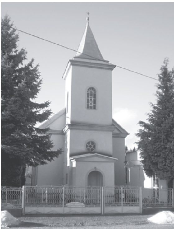
Pány református temploma