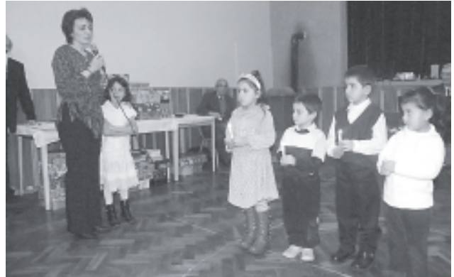
Az óvodások műsora