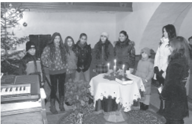
A hittanosok egyik csoportja