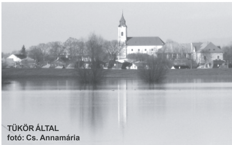
TÜKÖR ÁLTAL

Ilyen bűn például a mulasztás. Jakab apostol ezzel kapcsolatosan azt írja: Aki tudna jót tenni, de nem teszi, bűne az annak. (Jak 4,17) Bűn az elmulasztott imádság. Bűn az, amikor nem Istenhez fordulunk a baj a teherhordozás idején, hanem önmagunkban bízva akarjuk a helyzetet megoldani. Bűn az, ha a segítség vagy a felülrőlvaló ajándék után elmulasztjuk a hálaadást. Bűn az amikor nem Istennek tulajdonítjuk a szabadítást, hanem saját érdemünknek. Mulasztás bűne az amikor nem Istentől kérünk útmutatást, amikor nem az Ige fényében élünk.