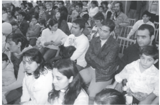
A résztvevők egyik csoportja

házi énekeket adott elő a Szalóka néptáncscsoport. Közben gondnokunk ismertette az egész projekt küldetését. Elmagyarázta röviden mikor és hogy indult ez az egész. A csoport további szolgálata közben a szeretetsomagokat szétosztotta gondnokunk a páskaházai polgármester közreműködésével. Utána szeretetvendégségre került sor ahol régi és új ismerősök elbeszélgettek mindennapos örömeikről, gondjaikról. Küldetésünket teljesítve vidám szívvel tértünk haza. Örül-