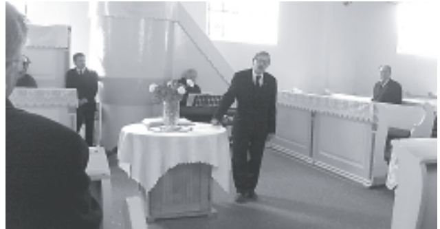
Gulácsy püspök úr