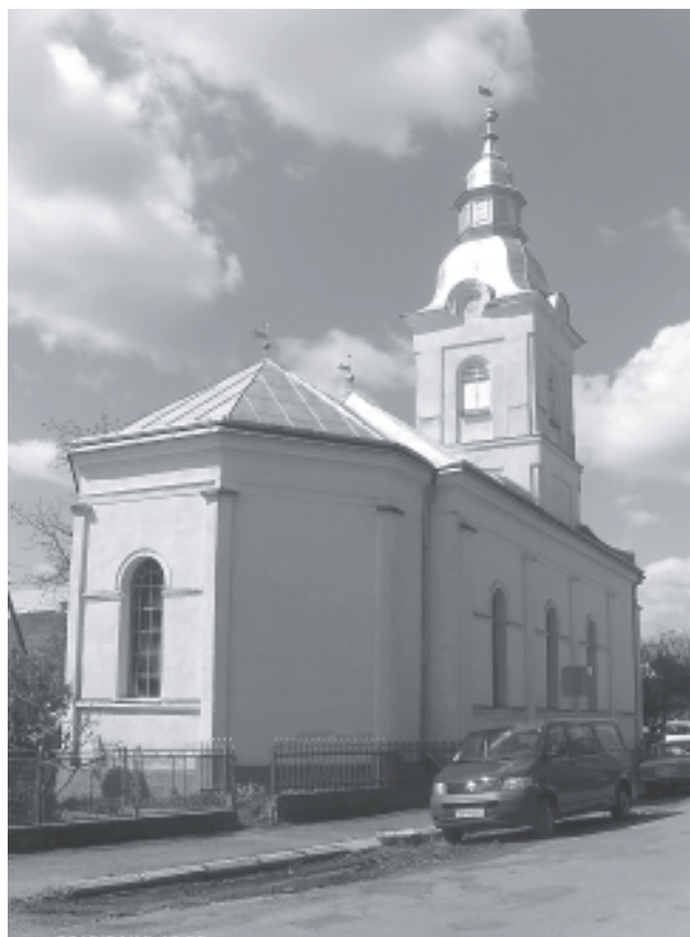
Tivadarfalva református temploma

tüzében az, amit Pál apostol ír a Filippi gyülekezetéhez írt levelében. Nekünk polgárjogunk van a mennyben, nem lehet parlamenti törvénnyel megvonni és érvénytelen népszavazással ellehetetleníteni. Onnan mindig egyértelmű jelzést kapunk a bennünket fogadó szeretetről, sőt onnan jön az igazi megoldás, az Üdvözítő. Nem átmeneti, emberek által kisebb-nagyobb többséggel megválasztott, vagy újraválasztásáért mindenre képes, hanem az aki mindenható Úr, Isten által elküldött. Olyan, aki minket erre a mennyi polgárságra megfellebbezhetetlenül kiválasztott, hogy ne aggódjunk hangoskodó Heródesek és Pilátusok között sem, hanem hűséggel várjuk Őt, aki nem feláldoz minket pilla-