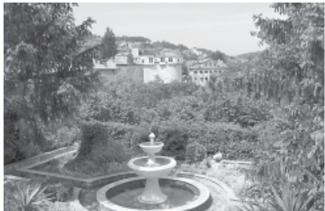
Pazin, Moutecuccoli vár

Jelentkezni a 056 6282560, 0908 035 094 –es telefonszámokon, vagy a csoma@copusnet.net e-mail címen lehet.