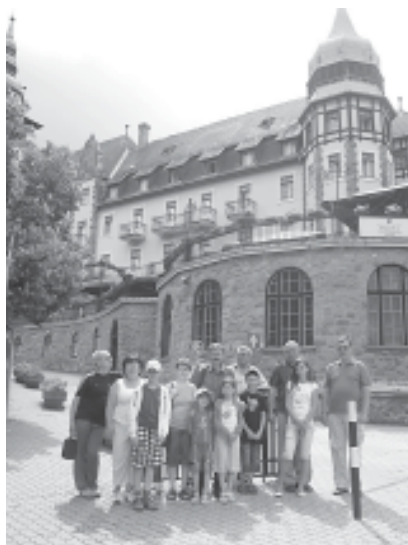
A nagyszálló előtt

megmutatták nemzetünk legjobb tulajdonságait. Első megállónk Lillafüreden volt, ahol a gyönyörű környezet mellett József Attilára is emlékezhettünk. Délután érkeztünk Egerbe, ahol a Villa Citadella panzióban nem csak szállás, de úszómedence, pezsgőfürdő, szauna is várta a vendégeket. Városnézés és hangulatos vacsora volt az aznapi program és persze az elmaradhatatlan fürdőzés. Vasárnapi reg-