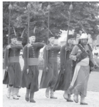
Őrségváltás az egri várban

megmaradás. A vár külön programokkal fogadta vendégeit. Őrségváltás, gazdag kulturális műsor mind azt szolgálják, hogy az idelátogatók ne csupán a rideg köveket lássák, hanem betekinthessenek a valamikor itt harcolók mindennapjaiba. A hazafelé ve-