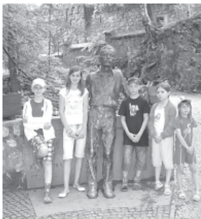
József Attila szobrával

szülöttje volt. Vajon mit tudnak erről azok a gyerekek, akik már nem magyar iskolába járnak? Vajon mennyire érzik át, hogy a magyar büszke lehet mindarra, amiben eleink