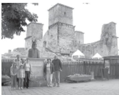
Diósgyőr vára előtt

gelit követően az ebédlőben tartottuk meg az istentiszteletet, s úgy indultunk a vár felfedezésére. Igaz csak pár száz métert kellett megtennünk, de így is elgondolkodhattunk azon, milyen hit és elszántság kellett ahhoz, hogy a mintegy 60-70 ezres török sereggel szembeszálljon a mintegy 2000 lelket számláló védősereg. Hit és hűség! Ezek nélkül nincs igazi helytállás és