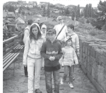
Séta a várfalon