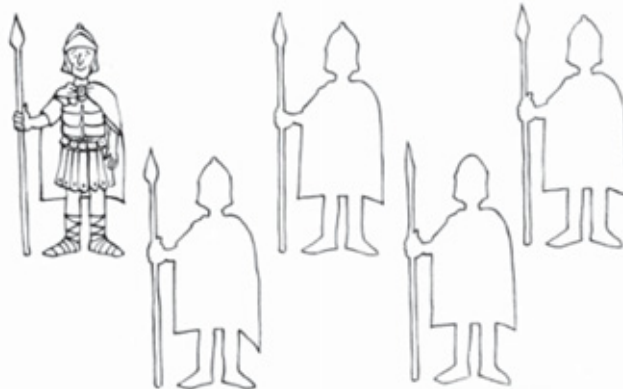
A négy közül melyik a katona körvonala?

Miért lehetett Pál ilyen bátor? Azért, mert tudta, minden, ami vele történik, az csak az Isten akaratából van. Ez elől az akarat elől nem lehet elmenekülni, és e mellett tudta, hogy Isten nem akar neki, nekünk rosszat. Még azt a rosszat is, amit ebben a mi életünkben érzünk, a javunkra fordítja az Isten. Ha tudod, hogy mit akar tőled az Isten, akkor azt bátran cselekedheted, még akkor is, ha ez sokaknak nem tetszik, mert az Isten melletted van és segít neked. Cselekedjék hát mindnyájan bátran az Isten akaratát.