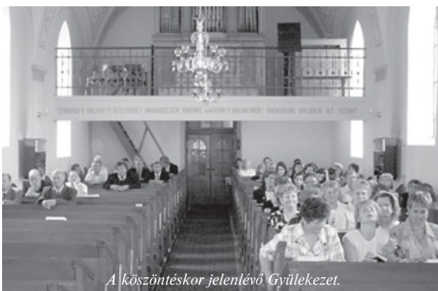
A köszöntéskor jelenlévő Gyülekezet.