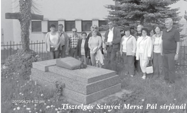
Tisztelgés Szinyei Merse Pál sírjánál

Bártfa városát lengyel cisztercita szerzetesek alapították a 12. században. A tatárjárást követően azonban német telepesek népesítik be, majd Nagy Lajos király szabad királyi város rangjára emeli. A német telepesek városformáló munkája