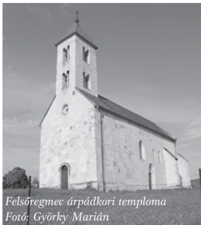
Felsőregmec árpádkori temploma

- Egy nyilatkozatban azt olvastam: „Istennek hála, folyamatban van egy nemzedékváltás.” Vajon miként tekint a nyilatkozó azokra a szolgatársakra, akik egy olyan korban szolgáltak, vagy léptek szolgálatba, amikor a most nemzedékváltó ifjabb korosztály tagjainak nem kis része, ha templomba el is ment, teológiára csak akkor ment volna, ha más egyetemre nem nyert felvételt? A nemzedékváltás mindig történik az egyházban, adjunk inkább hálát Istennek azért, hogy a lassan nyugdíjba vonuló nemzedék akkor is vállalta az ige hirdetését, amikor az Isten létének tagadásáért járt a jutalom, megbecsülés és elismerés.