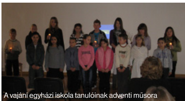
A vajáni egyházi iskola tanulóinak adventi műsora