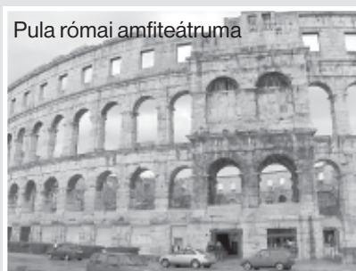
Pula római amfiteátruma

A tanulmányi kirándulás részvételi díja 325 Euró amivel a szállás, útiköltség és reggeli – vacsora kiadásait fedezzük.