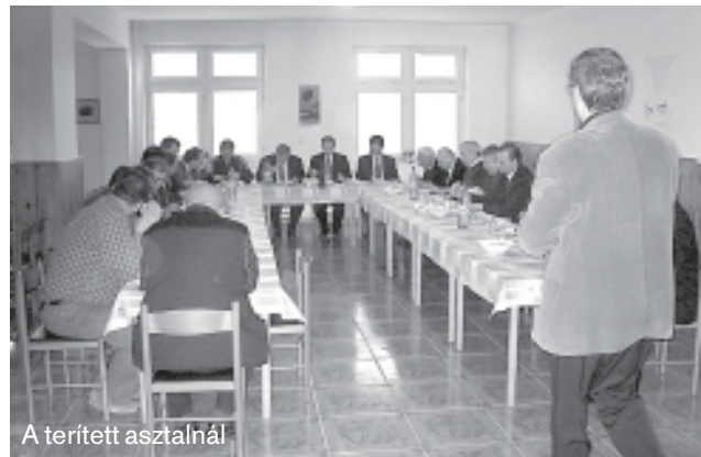
A terített asztalnál

A megbeszélésen szóba került az Európa több országában esedékes, így a különböző magyar református közösségeket érintő közelgő népszámlálás kérdése is. Az elnökség bátorítja az egyháztagokat, hogy a felekezeti hovatartozásra vonatkozó kérdés kapcsán vállalják reformátusságukat, és erre közös kampányban is fel kívánják hívni a figyelmet.