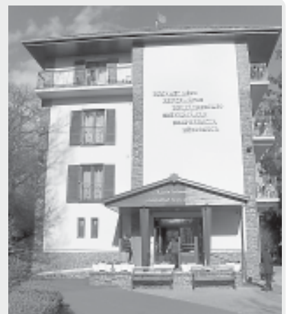
A mátraházi üdülő