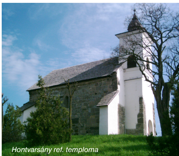
Hontvarsány ref. temploma

Visszagondolva a gyakran négyszeri szolgálatra, jóleső érzés