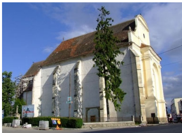
A tordai templom

Tehát az előttünk álló böjti napok arra szolgálnak, hogy