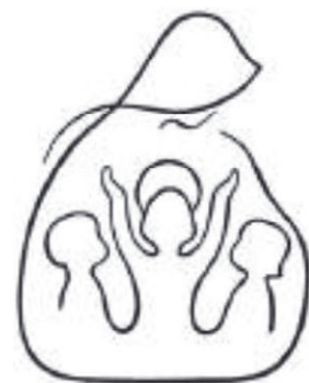
Simon András grafikája