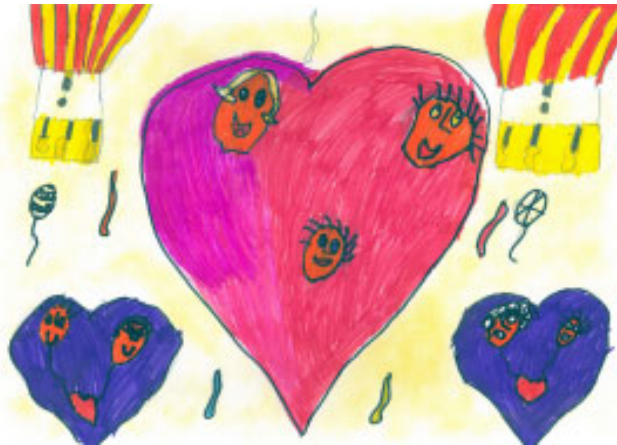
A kép a nagylévdi gyülekezetből érkezett

Jézus azért jött erre a világra, hogy megbocsátást hozzon nekünk. Megbékéltetett minket az Istennel, aki Jézus áldozatáért megbocsátja a mi bűneinket. Erről szól a húsvéti ünnep. Az Isten megbocsátásáról. De ugyanakkor szól a mi megbocsátásunkról is. Biztos ismeritek, sőt tudjátok is azt az imádságot, melyet Jézus tanított nekünk. A Mi Atyánkról van szó. Van benne egy mondat, ami a megbocsátásról szól. Bocsásd meg a mi vétkeinket, miképpen mi is megbocsátunk azoknak, akik ellenünk vétkeztek. Az imádság után pedig ezt találjuk megírva: Mert ha az embe-