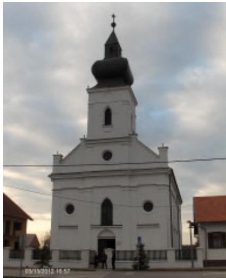
Kőrögy református temploma (Horvátország)

A magát Isten prófétájának tartó Mohammed, a hindu vallásos nevezetes tanítói, és a sok más vallások alapító, hirdetői nem tudnak végleges bizonyosságra senkit sem elvezetni. Vakoknak vak vezetői ók. Követők tévelygések útvesztőiben bolyongva, csak az üdvösséget kereső lelkek maradnak halálukig. A Kr. előtt kb. 560-480-ban élt Buddha legalább bevallja: „Én Buddha egyetlen bűnt sem bocsáthatok meg. De jön utánam valaki, akinek hatalma van arra, akinek kezét és lábát az emberek átszegezik.”