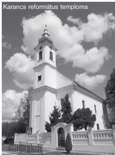
Karancs református temploma

A hazugság minden formájától való irtózás a Szentlélek jelenlétének egyik legjellemzőbb vonása. A Szentlélek első ismertetőjegyei (1Kor 12,10) között szerepel, hogy szemünket megnyitja a hazugság lényegének és munkájának meglátására. A hazugságot - a hazugság lelkét - azért nehéz felismerni, mert hasonló egységet, közös akaratot, tervszerű elgondolást testesít meg, mint amely egység az Istentől való szellemi-lelki történésekre jellemző. Éppen ezért a Sátán hazugvoltát - amint egy ember vagy csoport képében megjelenik - e világ megismerési lehetőségeivel vagy bizonyítási eszközeivel egyetlen ember sem leplezheti le, hanem csak Isten Lelke, aki a lelkek megítélésére megvilágosítja elménket. A Szentlélek lényegi eleme,