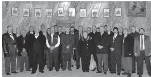
Emléktáblát avattak a parajdi sóbányában a református egyháztestek vezetői

A szombathelyi plenáris ülésen született felvetések nyomán a megbeszélésen döntés született –ugyancsak a Heidelbergi Káté megjelenésének 450. évfordulójához kapcsolódóan – egy Kárpát-