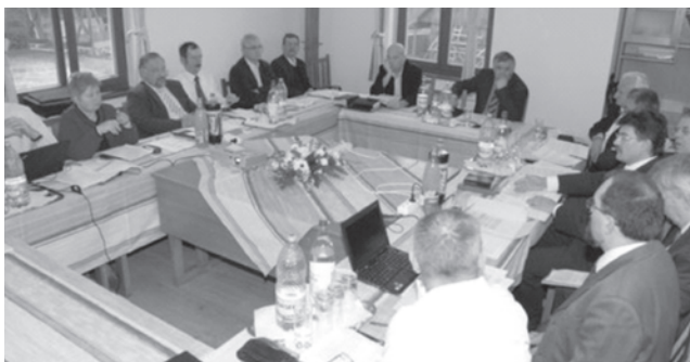
Parajdon tanácskozott a Generális Konvent Elnöksége

A Heidelbergi Káté megjelenésének 450. évfordulója alkalmából a GK nyári szombathelyi ülése 2013 júniusára hívta össze a Magyar Református Egyház Zsinatát, amelynek napirendjén a Káté új magyar szövegének elfogadása és a közös alkotmány néhány ponton szükségessé vált módosítása szerepel. A Kárpát-medencei református egység 2009. májusi deklarálása óta első alkalommal ül majd össze a testület. A közös zsinat megtartásának feltétele, hogy a részegyházak zsinatai a napirenden szereplő témákat 2013. január 31-ig előzetesen megvitassák. Az elnökség most megállapodott az esemény időpontjáról: a közös zsinat június 28-án tartja ülését Debrecenben.