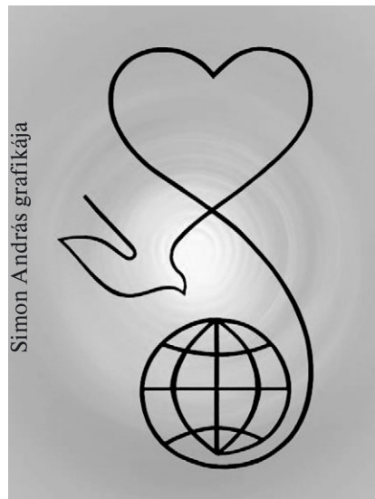
Simon András grafikája

Erről a csodálatos, határtalan szeretetről szól az egész Szentírás a szent atyák és próféták által. Már az Ő szövetségében is. Erről beszél Izráel népének a története. Ezt a