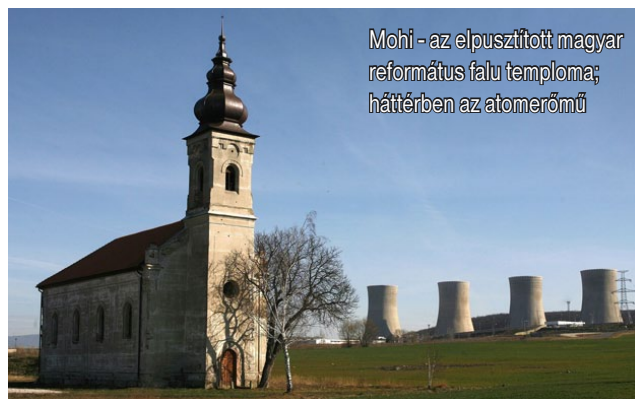
Mohi - az elpusztított magyar református falu temploma; háttérben az atomerőmű

1990. Végre szabadon imádkozhatod Jézusodat, mondom. Tudom, hogy bántóak a szavaim. De a pártban nagy a csend, félnek. Félünk. Mi lesz a munkámmal? Csak ő mosolyog, és előveszi a könyvek mögül édesanyja Bibliáját. Kedvem volna kezdet emelni rá, de józanul nem tudok ütni. Nem értem, miért zavar az öröme. Miért boldog, amikor minden elveszett?