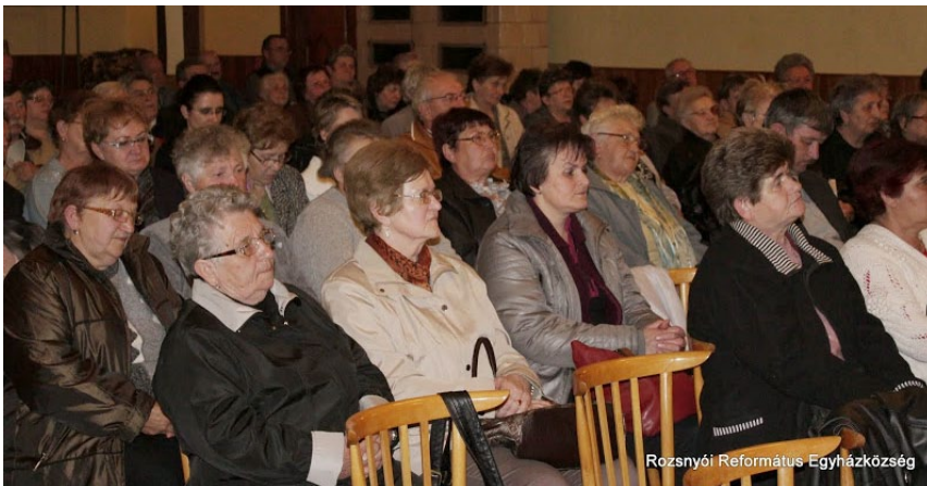
Rozsnói Református Egyházközség

Az alkalmak méltó befejezéseken lelkipásztoraink presbiteri csendnapot rendeztek, melyen a különböző gyülekezetek tagjai és elől járói