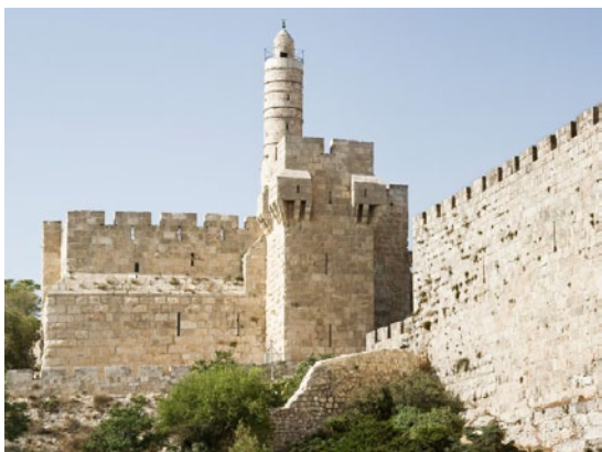
Dávid tornya - Jeruzsálem

A pusztai vándorlás időszakában Benjamin József törzsével együtt vándorolt úgy mint Efraim és Manassé. Ez azt jelentette, hogy Jákób kedves feleségének, Rachelnek leszármazottai külön csoportot alkottak. Jákób áldása ragadozóként jellemzi a legkisebb fiút, aki nem késlekedik elpusztítani azt, aki útját áll-