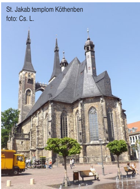
St. Jakab templom Köthenben

Isten Lelke kiárad a tanítványokra. Az első cselekvő, maga az Isten, aki Lelkében ismét a földre jön, de ezt most nem a tetet öltés csodája által teszi, hanem a szívekben lakozás által. Úgy, hogy övéit szenteli meg (hiszen a Szentlélek templomai lesznek), vezet és bátorítja. Ennek nyomán Krisztus teste, az egyház, a Lélektől erősítve, elrugaskodik, megmozdul, mozgásba lendül, megszólal. Krisztust hirdeti az ajka. Amit itt még álmélkodás és csodálkozás kísér. De