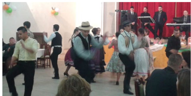
Az imahét végeztével Isten újabb átélhető öröme szólított minket: nyolcadik alkalommal rendezhettünk meg gyülekezetünk Batyus-