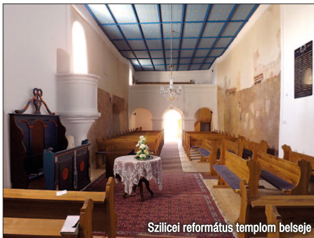
Szilicei református templom belseje

A hagyomány szerint Ostra (Istar) istennő napja volt a tavasz ünnepe.