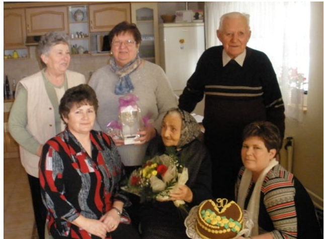
Az ünnepelt és leánya (balra áll), valamint a köszöntő gyülekezeti tagok

Íme, újabb mérföldkőhöz érteztél eme mai napon, Kívánom Neked, hogy továbbra boldog légy nagyon!