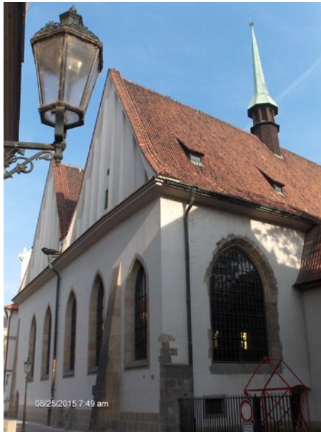
Bethlehem kápolna Prága A 600 éve megégetett HusJános temploma

A Jézus Krisztus tanítványai előtt elmondott ígéretek nemcsak annak a korszaknak szóltak. Jó részük valóra vált, és mi is ezekben élünk. Jövendölései - kiváltképpen az utolsó és végső időkre vonatkoznak, - azok is kétségtelenül beteljesednek majd... Ezért nekünk is fel kell tennünk a kérdést: Mi hasznát vesszük Krisztus menybemenetelének?... Felvehető Krisztust követő, őt szeretői lelkében az óhajlás, milyen jó lenne látni Jézust ma is úgy, amint földön töltött életében az akkor élők látták?!... Azonban nem veszítettünk mi sem azzal, hogy nincs közöttünk. Mert testben járva csak kevés helyen munkálkodhatott, gyógyíthatott és tanít-