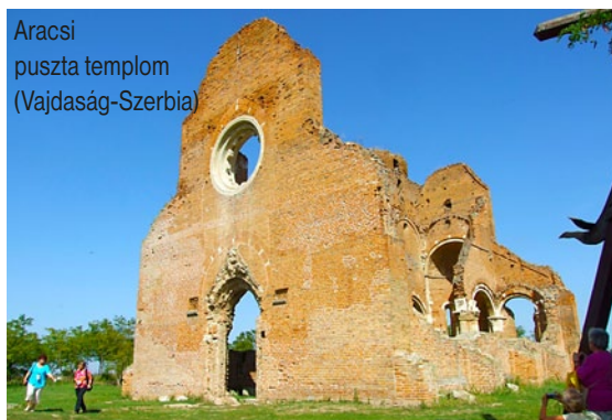
Aracsi puszta templom (Vajdaság-Szerbia)

detési alkalommal szívünkbe zárni a Szentírás szavait, nem kell, hogy aggodalmaskodjunk. Sőt még buzgóbban és odaadóbban kell aszerint élnünk, hogy életünknek Istentől kapott biztonsága, hitünknek Ige szerinti épülése tegyen biznyságot arról, hogy mi nem zűrzavarban, hanem az Úr rendjében és békességben élünk!