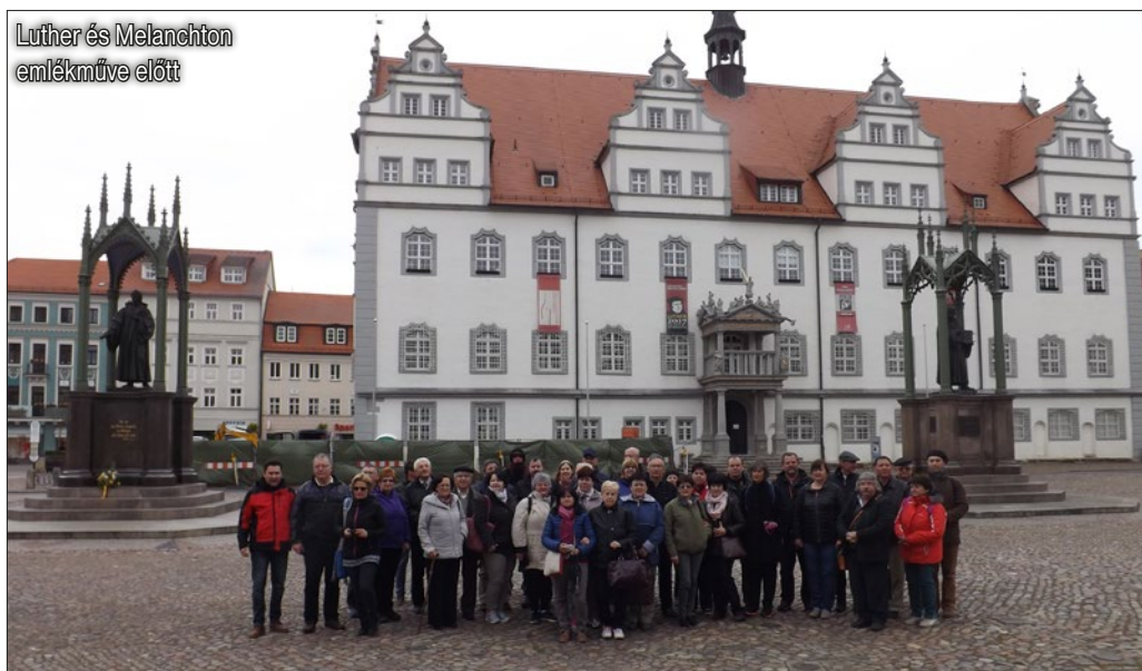
Luther és Melancton emlékműve előtt

hercegi parkban, ahol Anglia után földrészünk első klasszicista kastélya épült fel. Délután Wittenberg nevezetességeit kerestük fel. Mindannyiunk gondolatai az 500 évvel korábban lejátszódott események színterének megismerésére összpontosultak. Közvetlenül a vártemplom mellett léptünk be a történelmi városrészbe, s már ott is álltunk a nevezetes templomkapu előtt, ahova Luther kiszögezte 95 tételét. Tovább haladva az utcán szinte megelevenednek előttünk a Reformáció nagy egyéniségei. Igaz nem személyükben, hanem épületek és emlékművek formájában. Először a Cranach ház emlékeztet arra, hogy a Mindenható miként készíti elő ezt a várost arra, hogy az Ő megújító akaratát megvalósítsa. Lucas Cranach Bölcs Frigyes választófejedelem hívására érkezik Wittenbergbe