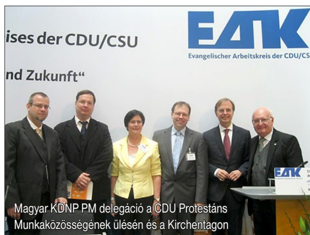
Magyar KDNP PM delegáció a CDU Protestáns Munkaközösségének ülésén és a Kirchentagon