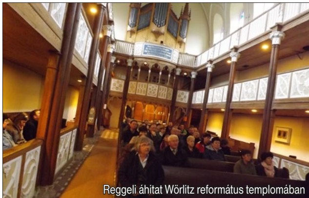
Reggeli áhítat Wörlitz református templomában

tett alkalomhoz csatlakozott a Borsod-Gömöri Református Egyházmegye is. A Kárpátaljáról érkezett két testvérünkkel, három országból, 45 résztvevővel indulhatunk el, sajnos az autóbussz technikai problémája miatt, mintegy három órás késéssel április 24-én. Egy nap alatt három fővároson, Budapesten, Pozsonyon és Prágán áthaladva értünk el a cseh-német határra. Nagy meglepetésünkre pár száz méter megtétele után a német rendőrök kivezettek az autópályáról, s egy ellenőrző pontnál nemcsak iratainkat vizsgálják meg, hanem adatainkat