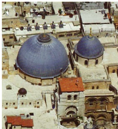
Balra a Szentsír bazilika, jobbra a Szikla-mecset és az Al-Aksza-mecset

Amikor a 7. században létrejött az iszlám és vele együtt az iszlám kultúra, egy olyan átfogó rendszer alakult ki, amelyet Al Haram Al-Sharif-nak nevez az mohamedán világ. Jellegzetes épülete a Szikla-mecset a zsidó alapokon és hagyományokon nyugszik. A kivitelező építészek nagyrészt bizánci keresztyének voltak, akiket a közeli Szentsír templom inspirált. A Biblia alapján megírt Korán meghagyja, hogy az iszlám vallás előtti híthősöket tisztelni kell. A 9. században élt történész, Ahmad al-Jakubi Dávid királyt mohamedánként könyveli el, aki éjjel és nappal imádkozott, minden második napon böjtölt. Szerinte, amikor „Dawud” legyőzi Góliátot, „Allah Akbar” kiáltással indul harcba és három kavicsot használ, amelyek Ábrahámé, Izsáké és Jákobé voltak hajdanán. Azon a helyen, amelyet a mohamedánok a Szikla-mecset felépítésére kiválasztottak, valamikor Salamon temploma állt. A zsidó hagyomány szerinti szent hely arra ösztö-