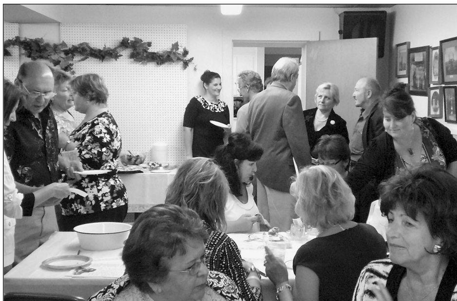
Magyar gyülekezeti ebéd Wallingfordon

– Még prágai szolgálatom idején megtapasztaltam az internet előnyeit gyülekezetépítés szempontjából is. Azóta megtanultam, hogy e kor adta vívmánynak számos hátulütője is van ám. Ahogyan a fent említett Felsőöri tanácskozáson elhangzott előadásomban elhangzott: Nem vagyok az Internet ellensége. Nagyon nagy lehetőséget látok benne. Nap mint nap kapcsolatban állok vele, és bizony sokkal nehezebb dolgom lenne, ha nem állna rendelkezésemre. Úgy gondolom, hogy az internet se nem jó, se nem rossz, hanem olyan, amilyenné tesszük.