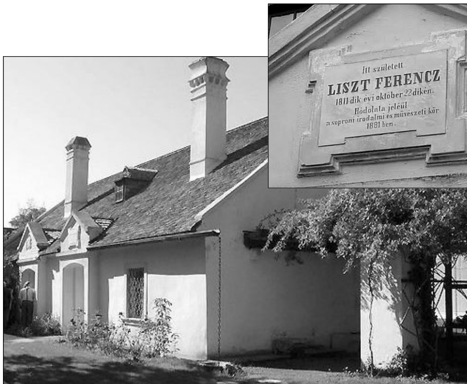
Liszt Ferenc zeneszerző szülőháza Doborjában