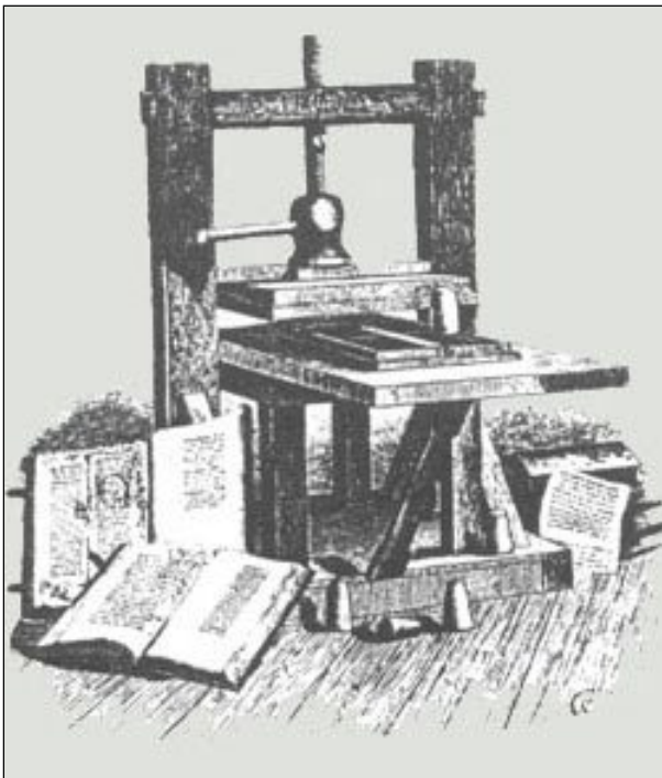
Egykori nyomda képe

A klasszikus újságformát megelőzte a röpirat. Számuk és tartalmuk alapján jónak és rossznak gyors terjesztői voltak. A reformációnak inkább ártott, mint használt. Luther 95 tétele is a röpirat kategóriába sorolható. Tekinthetjük Isten véletlenjének, hogy Wittenbergben nyomda is működött. Azt is, hogy a könyvnyomtatás feltalálása a reformáció eszköze lett. Azt is, hogy ebben az időben mozgalmas peregrinus-forgalom volt Magyar és Nyugat-föld között, és meglepő sebességgel érkezett ide Isten új szele.