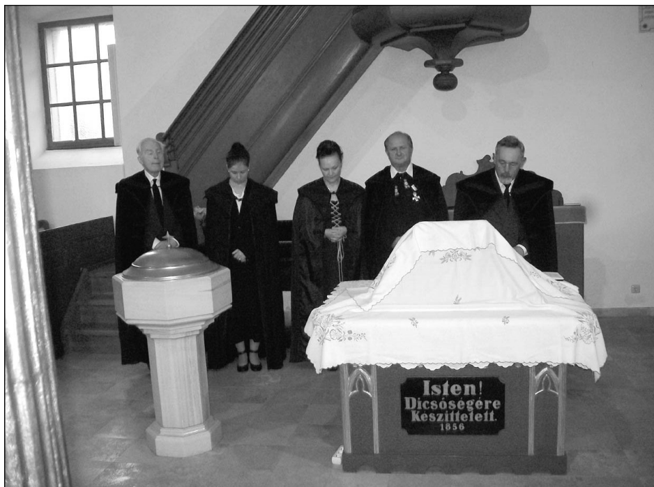
Úrvacsoraosztás a felsőöri templomban