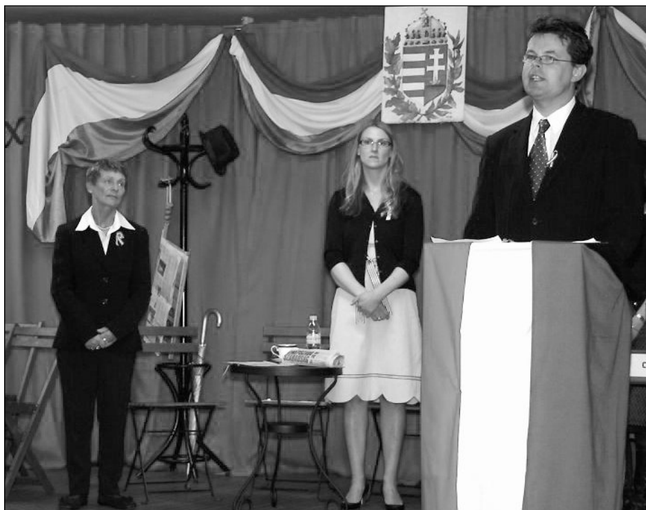
Bridgeport, október 23

– A kérdés egyszerűnek tűnik, a válasz annál sokkal bonyolultabb. Ráadásul, mert ha szó szerint akarom a kérdést érteni, akkor mérvadó választ sem tudok adni, hiszen sohasem szolgáltam „hazai” gyülekezetben. Összehasonlítani csakis a prágai gyülekezettel, illetve a felvidéki szülőfalummal tudom.