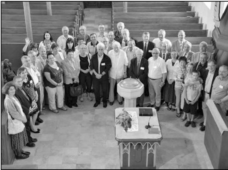
A felsőöri konferencia résztvevői

Hatvan év távolából is megrendítő ismertető hangzottak el anyaországi, délvidéki, kárpátaljai és erdélyi lelkészek tragikus sorsáról. 56-ban és általában a 20. században a legelesebb ellenálló lelkipásztorokat hurcolták el, ítélték halálra. Ifj. Fekete Károly debreceni püspök ifj. Varga Zsigmond bécsi lelkipásztorról szóló tanulmányából egy idézet: Egy gestapós tiszt felszólta a szószékre az igehirdetés közben: „Megvonom öntől a szót.” Varga Zsigmond azonban csendes határozottsággal azt válaszolta: „Önnek ehhez nincs joga és az istentiszteletünket sem zavarhatja.” A magyar Bonhoefferként emlegetett Varga Zsigmond is vértanúként fejezte be földi életét.