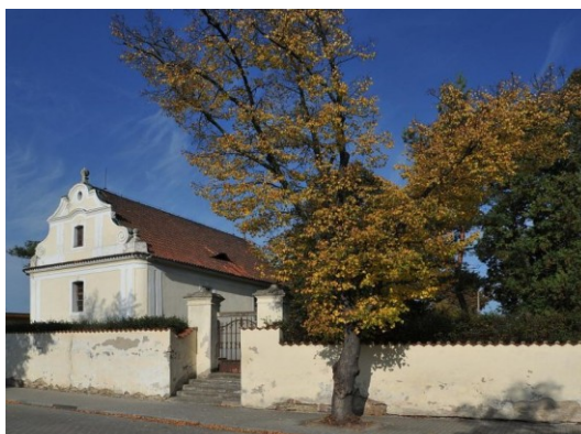
A libiši türelmi (tolerancia) templom