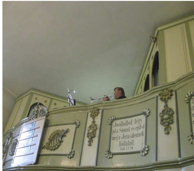
Magyar felirat a karzaton