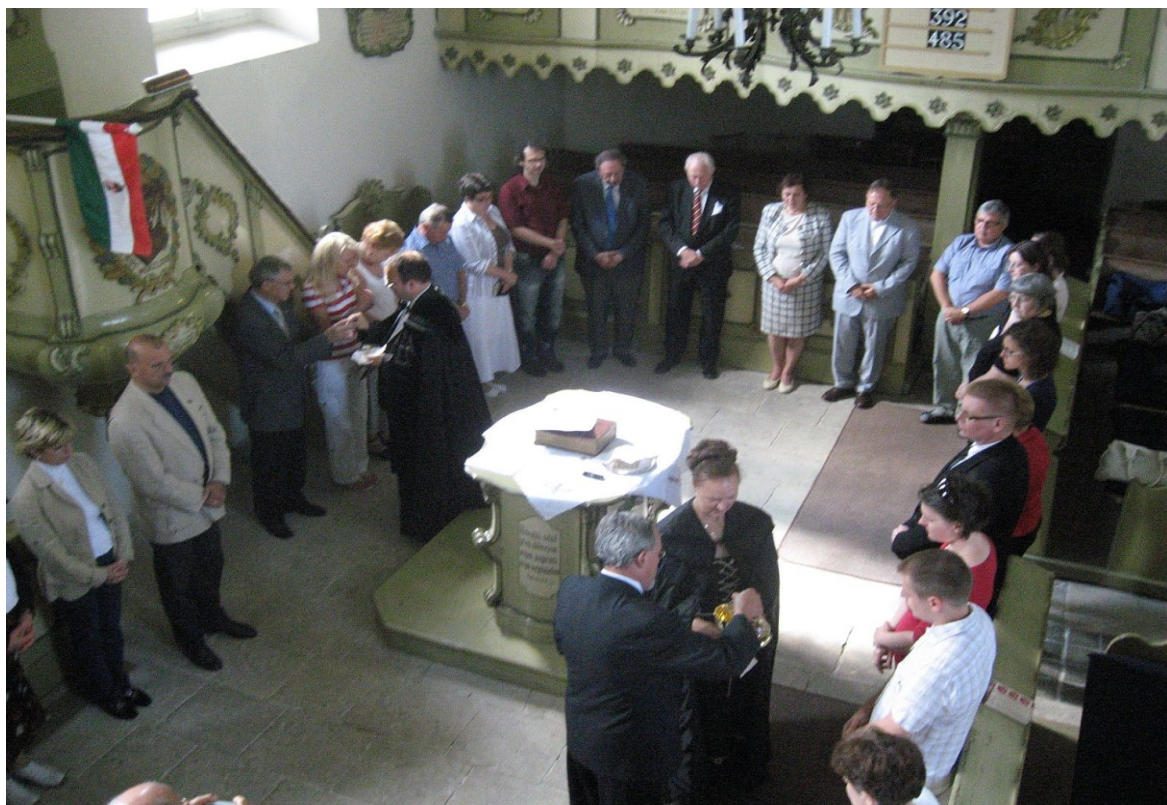
Úrvacsora Libiš-ben a NyEMRLSz 2011-es tanácskozásakor