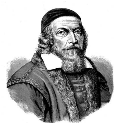
Johann Amos Comenius