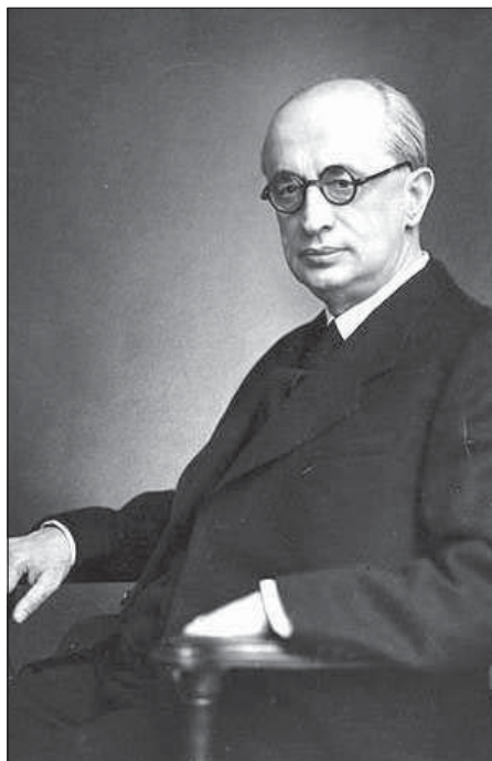
Ravasz László püspök

Landshuton alakul meg a Szórványban Élő Magyar Református Egyház, SZÉMRE rövidítéssel. Ennek jogfolytonossági örököse a Nyugat-Európai Magyar