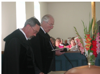
FELSŐŐR NyEMRLSz 2004