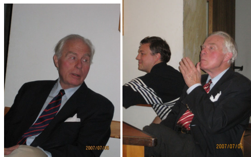
OBERWEIZ NyEMRLSz 2007