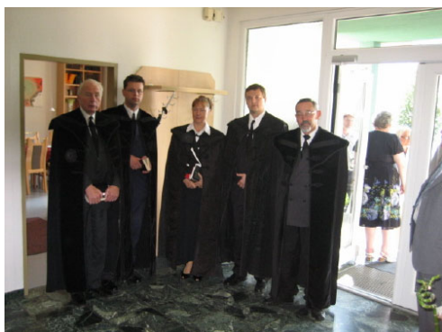
FELSŐŐR NYEMRLSz 2006