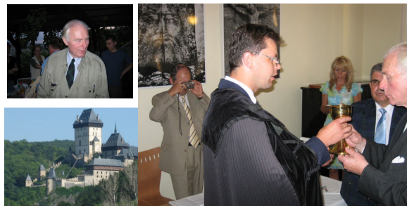
KARLSTEJN NyEMRLSz 2005