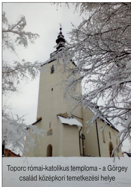
Toporc római-katolikus temploma - a Görgey család középkori temetkezési helye

halálózása esetén legyen miből fedezni a temetés kiadásait. Azon kívül, hogy elrendezzük hátra maradó dolgainkat, arra is el kellene készülni, ami előttünk van. Az apostol intően írja: „Ha csak ebben az életben reménykedünk a Krisz-