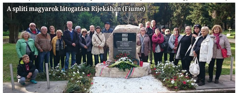
A spliti magyarok látogatása Rijekában (Fiume)

kezdettel az Egyesület klubhelyiségében mintegy 20 fő részvételével sikerült megrendeznünk a magyar kultúra napját (mivel az előző héten a rossz idő miatt nem állt módunkban). Az emléknapot Bešlić (Csoma) Annamária, alelnök köszöntője nyitotta meg, melyben röviden ismerette e nap jelentőségét. Majd különféle videókat tekinthettünk meg a magyar kultúra napjával kapcsolatban: a Hungarikumokról, a Táncháztanulmányokról, a magyar operett-, a 100 tagú cigányzenekar-, valamint a klasszikus nóta világából, melyet Fontányi Árpád, az egyesület alapító elnöke készített elő. A program részeként Sakalija Klotild, Tripolski Anikó elnök és Komenda László elnökségi tag szavazatát is meghallgathattuk.