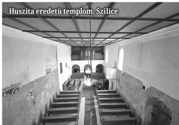
Huszita eredetű templom, Szilice

Ennek nagy jelentősége van, mivel korokban semmilyen társadalmi megmozdulás nem képzelhető el vallási indíték és igazolás nélkül. A pápa, a király, s a főpap a török ellen hirdette meg a kereszties háborút, ám a 40-50.000 fős, egybesereglett „szent had” hangadói – papok, deákok, szerzetesek – és vezetői – kis- és köznemesek – egyetértettek abban, hogy a török felett aratott győzelem feltétele az előzetes leszámolás a hazai istentelennel és törökbarát urakkal.