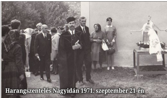
Harangszentelés Nagyidán 1971. szeptember 21-én

Akárhányszor valahonnan hazaérek, a parókia küszöbét átlépve különleges érzésem támad. Régi ez az épület. Bár ajtajai, ablakai, padlózata ki lett cserélve, sőt, a tetőzete sem az eredeti már, de a falak igen. A falakhoz a felújítások során nem nyúltunk, csak új vakolatot kaptak. Ezért, amikor egy-egy szobába belépek, sokszor eszembe jutnak azok a történetek, amelyeket az idősebb gyülekezeti tagok meséltek a gyülekezeti teremként szolgáló nappaliról, a váróteremként működő dolgozószobáról, vagy éppen az orvosi rendelőként szolgáló gyerekszobáról.