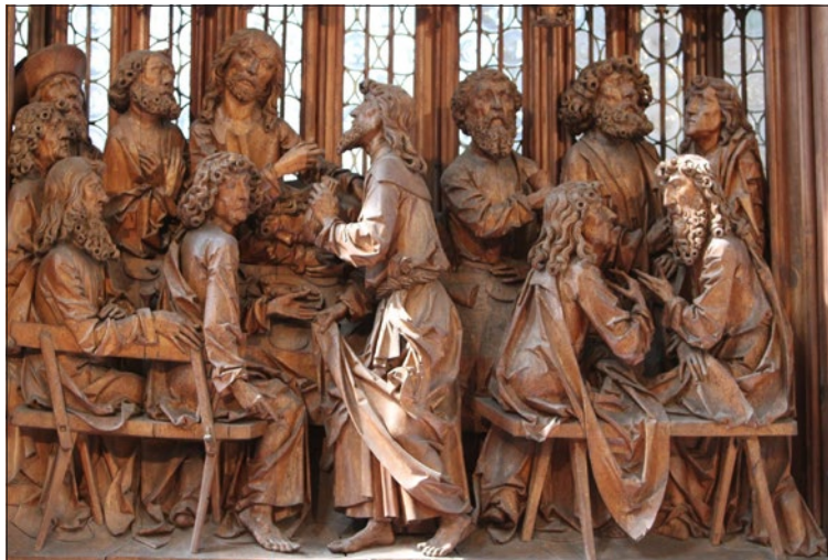
Utolsó vacsora - Tilman Riemenschneider alkotása 1499-1504 Rothenburg ob der Tauber

Hanem jól tudja Isten, hogy ha esztek belőle, megnyílik a szemetek, és olyanok lesztek, mint az Isten: tudni fogjátok, mi a jó, és mi a rossz.” (1Móz. 3:4-5) Azóta „tudjuk” és teremtményből halandók lettünk, annyira, hogy nincs hibátlan életet felmutató személy: „Mindnyájan elfordultak tőle, egyaránt megromlottak. Senki sem tesz jót, egyetlen ember sem...” (Zsolt. 14:3), sőt kevés hiányzott, hogy Isten eltörölje az emberi nemzetséget. „Amikor látta az ÚR, hogy az emberi go-