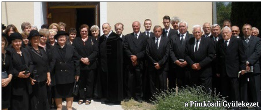
a Pünkösdi Gyülekezet