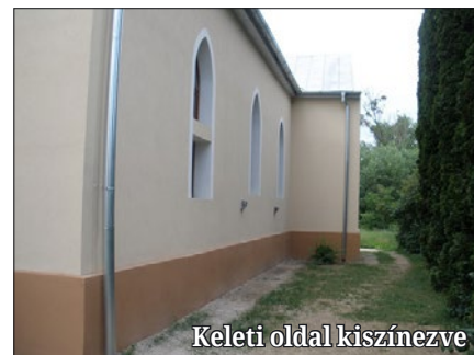
Keleti oldal kiszínezve

tartani azt az örökséget, amelyben ma is magyarul hangzik az Ige, s amelynek bejáratánál emléktáblák őrzik az I. és II. világháborúban hazájukért életüket ál-