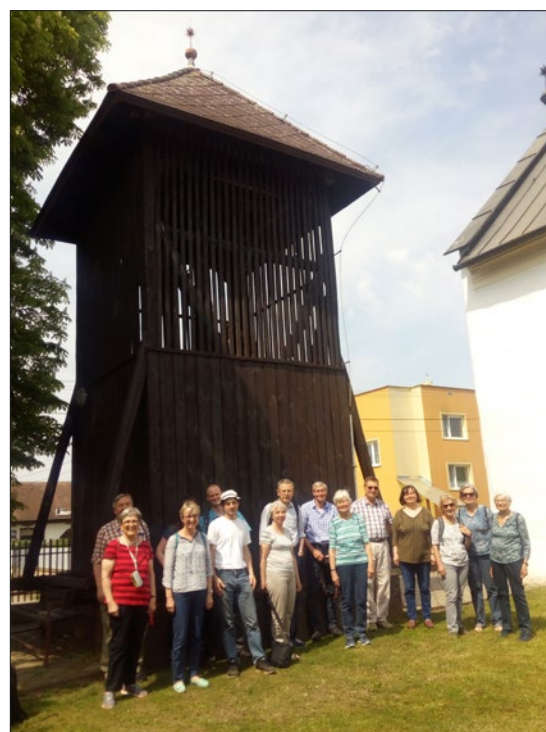
Svájci testvérekkel Csécsen

Szóval, közösség: ismét szabad példával élek: szabad választásom által, Felőbb Akarat gyanánt kerültem egy teljesen más kultúra kellős közepére immáron 7 éve. Hogy könnyű-e? Egyáltalán nem. Viszont olyan áldott pillanatok élek meg alkalomadtán, mely erősít abban, hogy nekem itt feladatom van. Miért? Talán a jövődöbéli „Közösség”