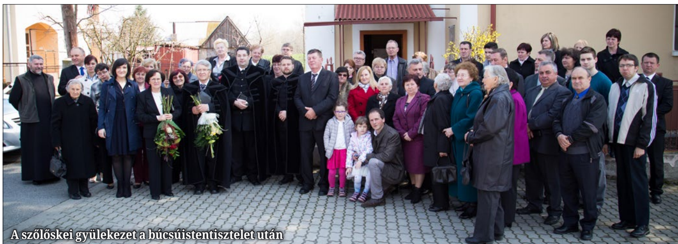
A szőlőskei gyülekezet a búcsúistentisztelet után

évek alatt a mag jó földbe került és termést hoz.