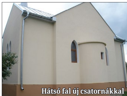
Hátsó fal új csatornákkal

Hálát adunk az Úrnak, hogy az Ő dicsőségére épült templomot évszázadokon keresztül megtartja, bele élő Gyülekezetet ad olyan hívekkel, akik templomjárók és adakozók. Köszönet illeti a Magyar Köztársaság Kormányát, hogy segít fenn-