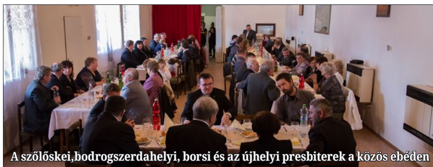
A szőlőskei, bodrogszerdahelyi, borsi és az újhelyi presbiterek a közös ebéden