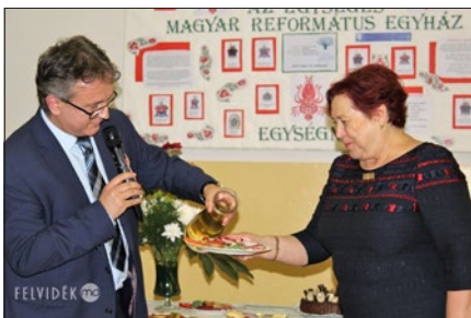
A kocsonya keresztelő

A Lévai Református Egyházközség fontosnak tartja a magyar közösség megerősödését, a közösségépítést és a keresztyén értékek továbbadását.