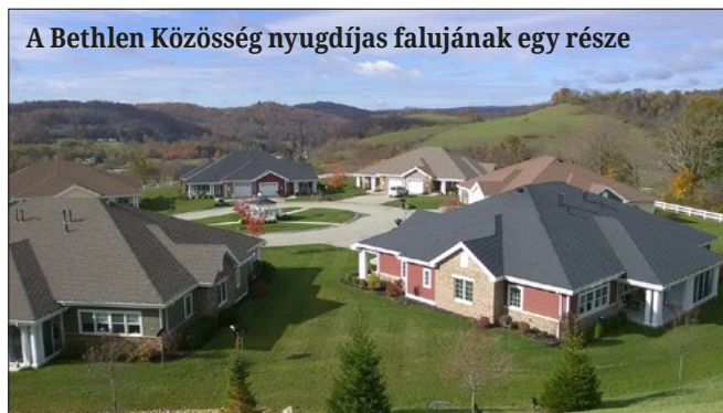
A Bethlen Közösség nyugdíjas falujának egy része

A Bethlen Közösség épületei festői környezetben épültek. A Bethlen Home egy dombtetőn található, ahonnan gyönyörű kilátás tárulhat a szemünk elé. A Ligonier Gardens Személyi Ápolást Nyújtó Otthonnak ablakából egy erdőszéli patakra nyílik kilátás, aminek a vize olyan kristálytiszta, hogy nem csak a vadkacsákat, hanem akár még a benne úszkáló halakat is messziről láthatjuk. A fákön mókások szaladgálnak, s nagyon gyakran látunk őzekeket is a közelben.