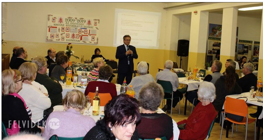
Az alkalomnak a Juhász Gyula Alapiskola étterme adott otthont (Fotó: Pásztor Péter/Felvidék.ma)

„Ez is az egyház és az iskola erős kapcsolatát bizonyítja, ami nagyon fontos üzenettel bír a közösségeink felé” – hangsúlyozta az esperes-lelképásztor.