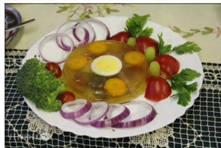
A díszasztal egyik kocsonyája

Arra a kérdésre, hogy miben más a két gyülekezet, a szigetszentmiklósi lelképásztor a következőket mondta: „a lévai gyülekezet kétszeresen is kisebbségben élő közösség, amely a fennmaradásért küzd. Ugyanakkor hasonlóság köztünk, hogy az európai keresztyénség értékeinek megmaradásáért küzdünk, meg kell találnunk azt a lehetőséget, amivel az evangéliumot hirdethetjük az emberek közt. Érvényes üzenetével próbáljuk élni az életünket, példát mutatva más közösségeknek.”