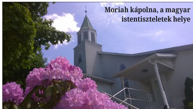
Moriah kápolna, a magyar istentiszteletek helye

lent: „Isten gondot visel”. S milyen érdekes, hogy ez a név teljesen megegyezik az itt végzett elkötelezett szolgálattal. A Moriah hegy tetején található a Bethlen Közösség kápolnája is, ahol a környékbeli magyarság számára tart istentiszteleteket a szeretetotthon lelkésze.