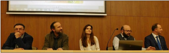
A családi délután előadói

A Köldökszinór programot 2018-ban a Felvidéken az érintettek mindössze 10%-a vette igénybe, ezen az arányon kíván változtatni a Szövetség a Közös Célokért (SZAKC) társulás.