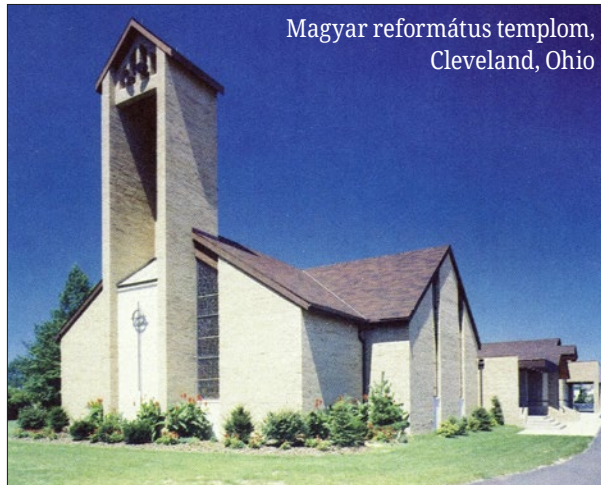
Magyar református templom, Cleveland, Ohio

E szép és veretes képletes beszéddel az ígéri meg Isten, hogy aki lelkét hittel átadja Istennek, azt Ő az élet vizének forrásából ingyen megelégti. Ehhez az átadáshoz bátorság és állhatatosság kell. A gyávákra, a hitetlenekre és más felsorolt istentelenekre azonban nem ez a sors vár, ők kirekesztik magukat e boldogságból.