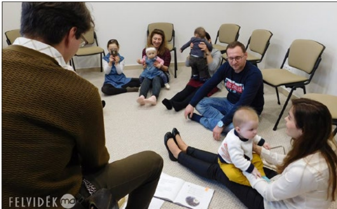
Ringató foglalkozás a Csillagházban

A Csillagházban először volt Ringató foglalkozás, ahol erre az alkalomra alakítottak ki alkalmas teret a tanácsteremben. A zenei kíséretet Endrődi Attila , a Petőfi program füleki ösztönődjasa biztosította.