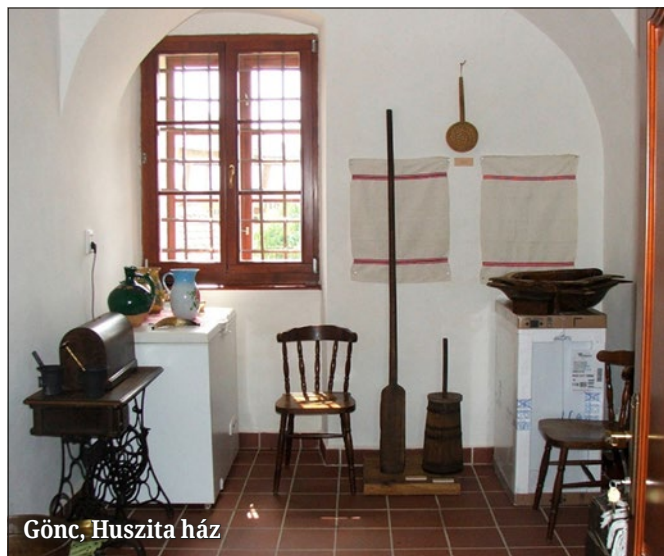
Gönc, Huszita ház

A huszita jelenlétnek, a negatív történések ellenére pozitív hatásai is voltak. Nem feladatomban a hadászati és stratégiai módszerek elemzése, de Mátyás király sikeresen felhasználja e