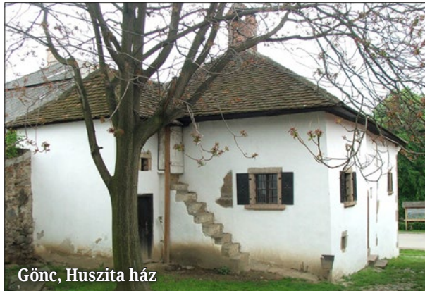
Gönc, Huszita ház

A hitújítás kiemelkedő mérföldköve Husz János és a halálát követően kibontakozó huszita mozgalom, amely az 1420-as években nem talál legyőzőre Csehország területén. Annak ellenére, hogy a nemzetközi összefogással megvalósított kereszties hadjáratok csúfos vereséggel végződnek, nincs igazi remény arra, hogy meg egyezésre jussanak hitelvi kérdésekben a katolikus egyházzal. Ez főleg a radikális szárny, a táboriták hitelvi álláspontjának következménye. A táboriták kitűnő hadvezére, Ján Zsizska, a kor stratégiai elveit követve, úgy kíván kedvező tárgyalási pozíciót kiépíteni, hogy az ellen-