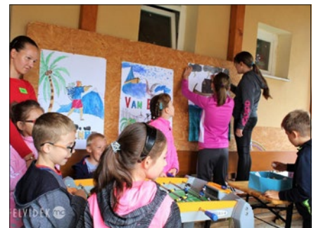
Számos foglalkozás várta a táborlakókat

A tábor zárása a vasárnapi istentiszteleten lesz, ahol bemutatják a tanult énekeket, felelevenítik a bibliai üzeneteket. A tábor szervezését nagyban támogatták a szülők is, akik a tízóraihoz és az uzsonnához valót gyűjtötték össze.