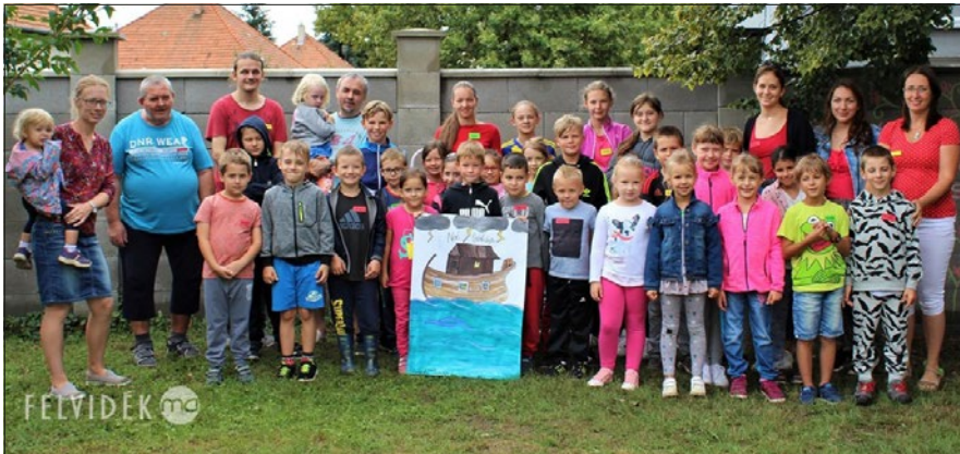
Az tábor résztvevői a parókia kertjében

Az Ipolysági Református Egyházközség augusztus közepén immár harmadik alkalommal szervezte meg napközis táborát. Idén titkos ügynökök segítették az örömhír közvetítését a gyermekek felé.