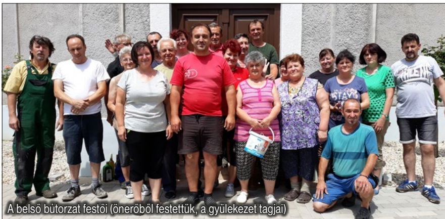
A belső bútorzat festői (önerőből festették, a gyülekezet tagjai)

egy új talajcsempe takarja, melyen csillog van. Tudva levő, hogy maga a csillog reformátusságunk egyik szimbóluma. Egykor a betlehemi csillog vezette a bölcséket Jézushoz, ezért a templomtornyon levő csillog szimbolizálja az útmutatást Istenhez. A csillog jelzi, hogy szükségünk