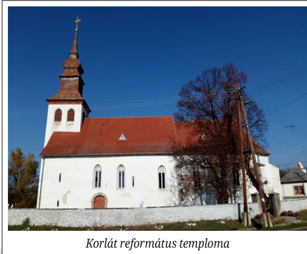
Korlát református temploma

Luther mindezt aggódva és nagy félelemmel pillantott az Isten igazságosságára. Am most rájött, hogy Isten igazságossága nem azt jelenti, hogy Isten egy bosszúálló Isten, még csak azt sem jelenti, hogy kénye kedve szerint osztogatja az elismerést, vagy a büntetést. Isten igazságossága egy megmentő igazságosság, mellyel Jézus által nekünk tulajdonítja mindazt, amit