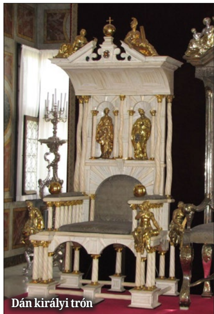
Dán királyi trón

Dániel könyvében olvassuk ezt a mondatot: „ És míg én szemlélém, ímé, egy kecskebak jöve napnyugot felől az egész föld színére, és nem is illetté a földet; és ennek a baknak tekintélyes szarva vala az ő szemei között. És méne a kétszarvú koshoz, amelyet láték állani a folyam előtt; és feléje futa erejének indulatában. “ (Dániel 8:5-6) Így merült fel bennem a gondolat, hogy utána kellene járnom az egyszarvú történetének.