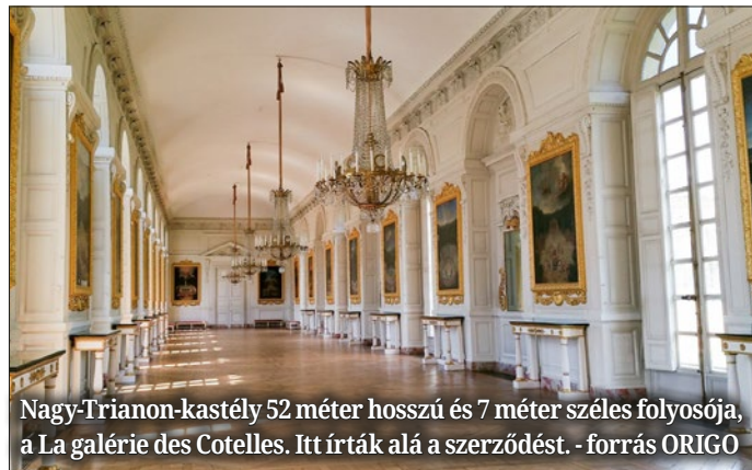
Nagy-Trianon-kastély 52 méter hosszú és 7 méter széles folyosója, a La galerie des Cotelles. Itt írták alá a szerződést.

gom szakítani a kezedből az országot, és a szolgáltnak adom. Dávidért azonban Júdát meghagyja Roboámnak, Salamon fiának, de a többi törzs Jeroboámnak, Salamon szolgájának uralma alá kerül. Salamonban fel sem merül az önvizsgálat, bünbánat, megtérés gondolata. Annyira azonosult kora zsarnokainak gondolkodásmódjával, hogy a megoldást Jeroboám megöletésében látja. Milyen távol került Istentől?! Teljesen elfeledkezett már arról, hogy ő a trónörökös sorrendben mennyire hátul kullogott, s bár az ő elpusztítására is voltak tervek, de akit Isten kiválasztott, azt Ő meg is oltalmazza! Isten az Ószövetség népét nem csak két részre szakítja, hanem egyszer