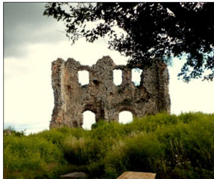
Vár állott, most kőhalom - Torna romjai

len hivatalos nyelvén, és még azt is megszabják, hogy ezt nem tehetjük kisebb betűvel, mint a magyar szöveget, és ha nem tesszük, akkor jön a megtorlás, pénzbírság, felszámolás.... Ennyire félnek és rettegnek még mindig azon oknál fogva, hogy a magyar népesség száma 100 év alatt csupán a felére csökkent, miközben a szlovákok gyarapodása két és félszeres volt. Micsoda undorító népség vagyunk mi, hogy még mindig nem voltunk szívesek belepustulni a feldarabolásba, kisémmzésbe, megtorlásokba, jogfosztásokba, deportálásokba, lekiacsinylésekbe, megaláztatásokba és a