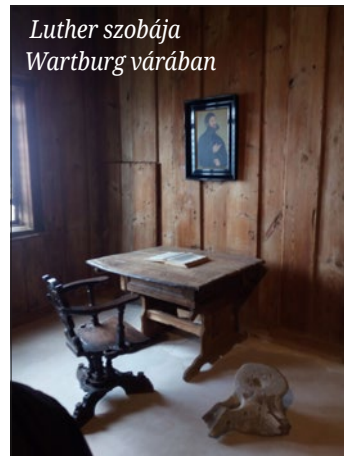
Luther szobája Wartburg várában