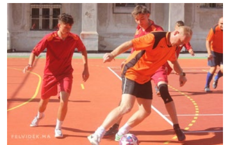
Szülők, tanárok és a diákok csapat mérkőzött egymással