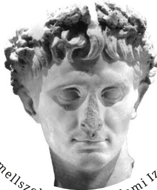
Heródes király mellszobra a Jeruzsálemi Izrael Múzeumban

Gershon Nerel, Israel Heute; ford. Csoma L.