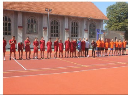
Sportpálya átadás Rimaszombatban