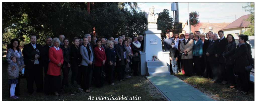
Az istentisztelet után