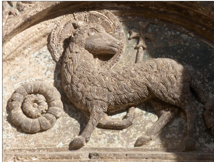
Zadari szent Anasztázia-székesegyház oldalkapu díszje

A Jelenések könyvében azt olvassuk, hogy a Gonosz új és új formában jelenik meg, azt sugallva, hogy ő is képes feltámadni. Ebben az a félelmetes, hogy a látszat elfogadására hajló ember elhiszi ezt, s szolgálatába szegődik, meg sem vizsgálva, kit is szolgál. Egyre inkább képtelen észrevenni, hogy a nagy hangon hirdetett „emberség” és a „másság elfogadása” jelszava mögött embert elkárhóztató szándékok állnak, mert a Gonosz különböző megjelenési formái mindent ígérnek a földi embernek, csak FELTÁMADÁST és ÖRÖK ÉLETET nem.