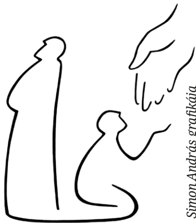
Simon András grafikája